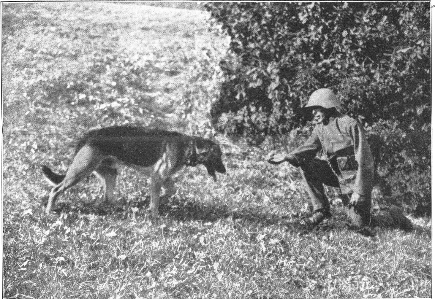
Die Kriegshunde der 2. Division Ankunft eines Hundes auf dem Kommandoposten

Offizielles Organ des Schweiz. Unteroffiziers-Verbandes