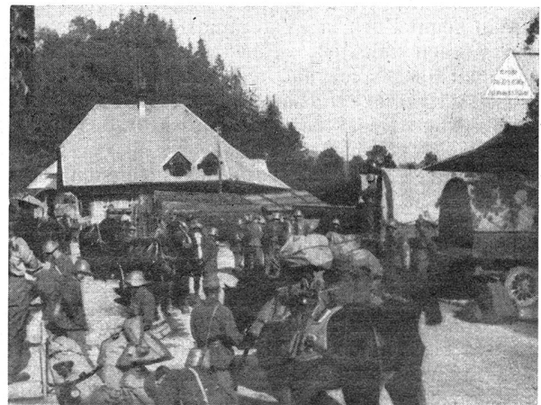
W.-K. der Geb.-I.-Br. 9 — C. R. de la Br. I. mont. 9 Fassungsplatz Eggiwil — La place de ravitaillement d'Eggiwil

Eingeleitet wurde die Schlacht durch ein großes Reitergefecht bei Liebertwolkwitz am 14. Oktober, das