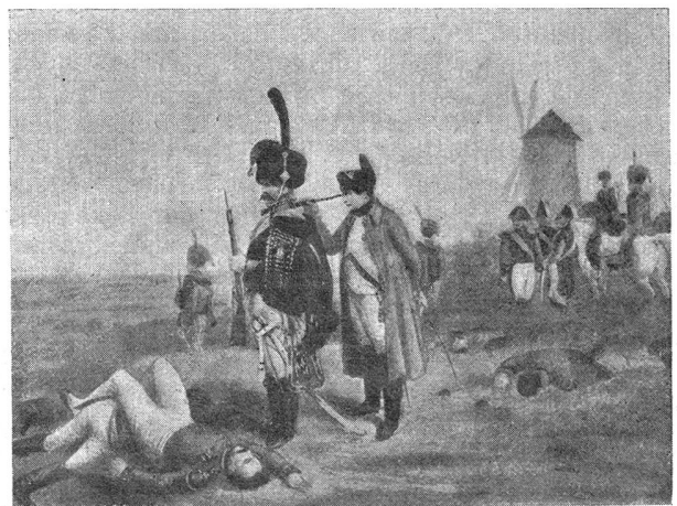
Napoleon bei Leipzig, 18. Oktober 1813 Napoléon à Leipzig, le 18 octobre 1813

Auf den andern Kampfplätzen war der Angriff Gyulais mit seinem österreichischen Korps gegen Bertrand gleichfalls ergebnislos geblieben. Nur Feldmarschall Blücher war mit seiner schlesischen Armee bei dem Dorfe Möckern zu einem klaren Siege gekommen, der für Napoleon mittelbar verhängnisvoll werden sollte. Blücher war eiligst von Halle aufgebrochen und traf noch rechtzeitig bei Leipzig ein, um entscheidend an dieser weltgeschichtlichen Schlacht teilzunehmen. Marmont war willens, mit seinem 6. Korps Napoleon bei Wachau zu Hilfe zu eilen, als er von dem gerade eintreffenden Blücher festgehalten und zur Schlacht gezwungen wurde. Da die unter dem Befehl des Kronprinzen von Schweden, Bernadotte, stehende Nordarmee der Verbündeten nicht rechtzeitig eingetroffen war, welche die linke Flanke der Blücherschen Armee decken sollte, sah sich Blücher gezwungen, das französische Korps Marmont nur mit dem 21,500 Mann starken Korps Yorck anzugreifen. Marmont hatte das Dorf Möckern zu schwerster Verteidigung eingerichtet, um das sich dann auch