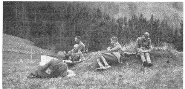
Das Kdo. des Geb.-I. R. 18 in den Manövern an der Arbeit Le cdt. du R.-I. mont. 18 au travail pendant les manœuvres

Die Verpflegung für den 22. September mußte am 21. die Distanz von zwei guten Tagmärschen von Habkern bis Heidbühl und Blapbach zurücklegen. Am frühen Morgen wurde der Grünenbergpaß mit den 18 Fourgons der Geb.-Vpf.-Kp. III/3 ohne Vorspann in Angriff genommen. Gegen 17.00 erreichten sie den Fassungsplatz Schangnau, wo die Verpflegung auf den Fassungsbaumtrain des R. 17 gebastet wurde. Da aber feindliche Flieger den Fassungsplatz mit Bomben belegten, wurde der Fassungsbaumtrain eines Bat. « außer Gefecht » gesetzt, und es mußten die mit den Hilfsbastsätteln versehenen Fourgonpferde des R. zu Hilfe gezogen werden. Trotz dieser durch Gelände, Witterung und feindliche Einwirkung verursachten Hindernisse und Hemmungen