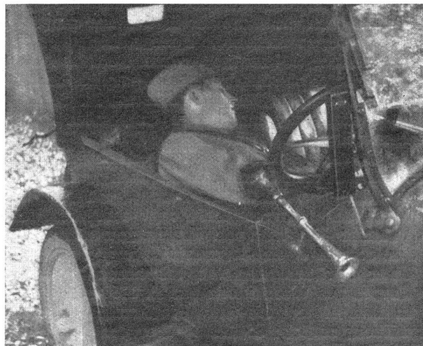
Die Chauffeurs haben während der Manöver strengen Dienst Les chauffeurs ont un service pénible pendant les manœuvres Bild 9

Alle Anzeichen deuten darauf hin, daß um das Militärbudget 1933 in der diesjährigen Dezembersession der eidgenössischen Räte ein Großkampf entbrennen wird. Der Chef des Eidg. Militärdepartements legt für 1933 ein Budget in der Höhe von Fr. 94,366,000.— vor, gegenüber 96,8 Millionen in diesem Jahr. Die Einsparung von 2,5 Millionen Franken ist erzielt worden durch die Abschaffung der Rationspferde für die Truppenkommandanten und Generalstabsoffiziere und die Einschränkung des Inspektionsrechtes für Truppenkommandanten und Heereseinheitskommandanten (Fr. 90,000), dadurch, daß im Jahre 1933 ein Jahrgang weniger zum Wiederholungskurs einrückt als gesetzlich vorgeschrieben ist (1,5 Millionen Franken) und durch Verkürzung der obligatorischen Schießübungen von 5 auf 4 (220,000 Fr.). Die sozialdemokratische Fraktion der Bundesversammlung aber ist nicht befriedigt von diesem sichtbaren Zeichen des guten Willens zum Sparen. Sie will aufs Ganze und daher hat sie bei Schluß der letzten Session der Räte eine Motion eingereicht, durch die sie für 1933 und 1934 eine Kürzung des Militärbudgets um je 30 Millionen Franken fordert. Eine solch gewaltige Reduktion aber würde nicht mehr und nicht weniger bedeuten als Verunmöglichung des Militärbetriebes. Da man einer Initiative auf vollständigen Abbau der Armee keinen Erfolg zutraut, versucht man's auf diese Weise. Es hängt von der Haltung der bürgerlichen Ratsmitglieder ab, ob dem Vorstoß von links Erfolg beschieden sein wird oder nicht.