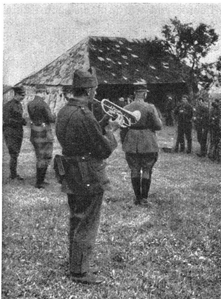
Gefechtsabbruch — Cessez le feu Bild 8

konnte die Verpflegung in der Nacht vom 21./22. September noch rechtzeitig der in der Gegend von Heidbühl und bei Blapbach nächtigenden Truppe übergeben werden.