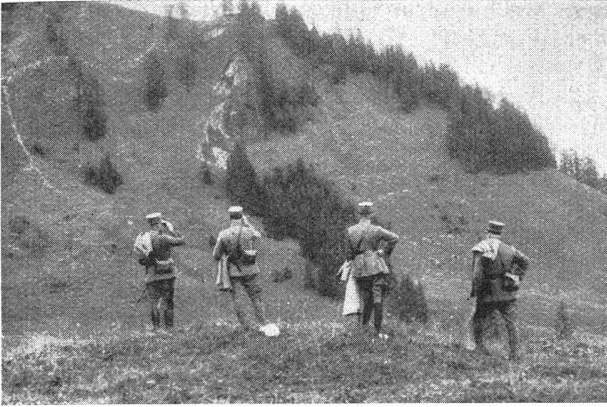
Der Korps-Kdt. und der Div.-Kdt. verfolgen die Bewegung der Truppe bei Kadhaus

Le cdt. de corps et le cdt. de div. suivent le mouvement des troupes près de Kadhaus Bild 6