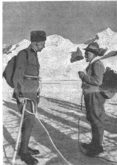
Der Leiter des Patrouillenkurses im Gespräch mit dem Bergführer Le chef du cours de patrouilles en conversation avec le guide de montagne