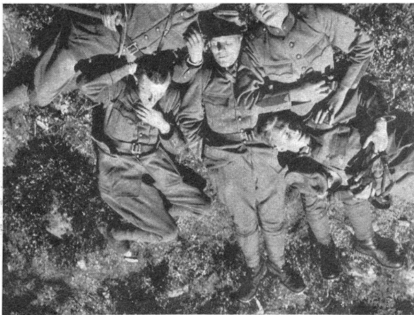
Nach getaner Arbeit ist gut ruh'n auf friedlicher Alp im sonnigen Lötschental Qu'il est doux une fois le travail terminé de prendre, dans la paix de l'alpe, un peu de repos au soleil du Lötschental

Auch diese zweite Uebung hatte ihren Zweck, die Schulung von Patrouillen im Gebirge sowohl bei Tag und bei Nacht und in wechselndem, schwierigem Gelände in Fels und Eis, voll und ganz erreicht. Lüthy.