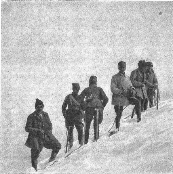
Gipfelrast auf dem Wetterhorn Un peu de repos sur le sommet du Wetterhorn