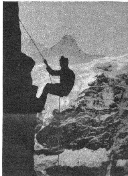
Abseilübung an der Südwestflanke des Wetterhorns. Im Hintergrund das Kleine Schreckhorn