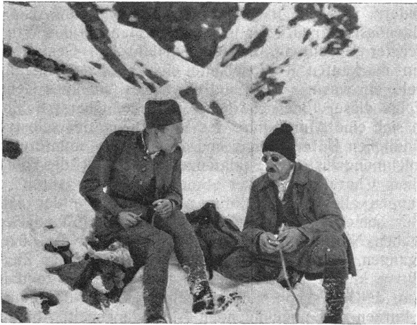
Das Kommando beim Znüni im Wettersattel Le commandant fait « les 9 heures » au « Wettersattel »

Unvergeßlich schön war der erwachende Tag. Ein wogendes Nebelmeer lag über dem Grindelwaldtal, die oberen Regionen aber prangten bereits schon im rosigsten Sonnenlicht. Murmeltiere spielten vor der Hütte, und keine fünfzig Schritte weiter weidete friedlich ein Rudel Steinböcke.