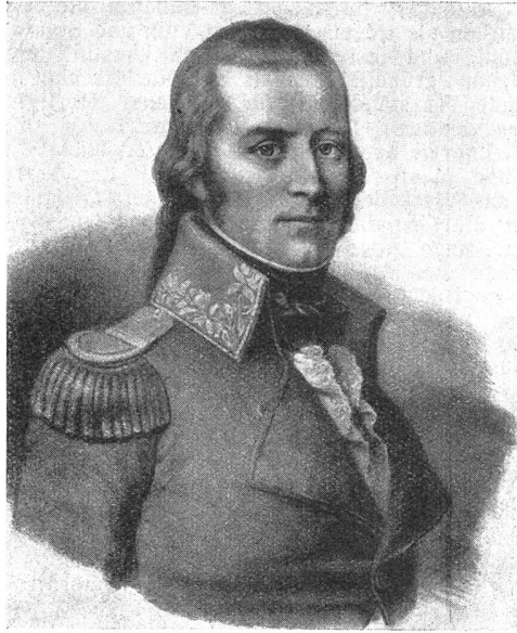
Colonel Aloys de Reding

composer un chant de l'Iliade ou une tragédie de Corneille? »