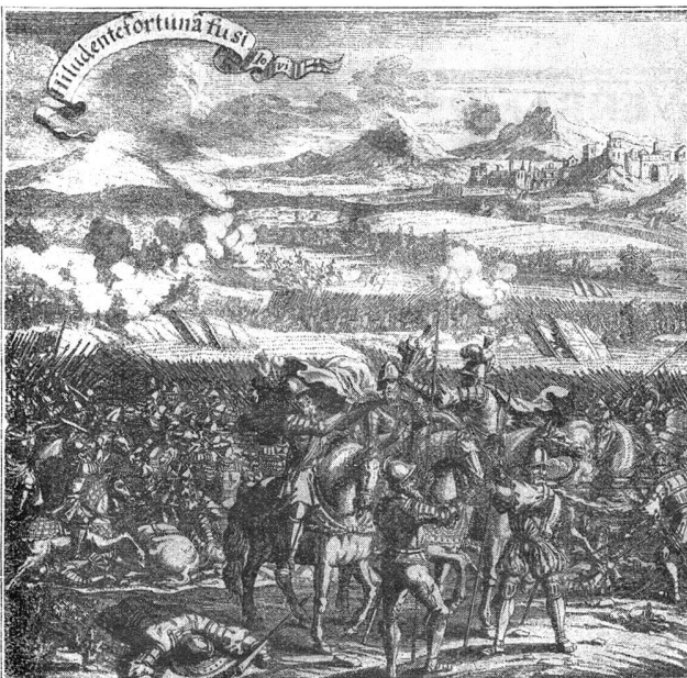
La Bataille de Novare

En outre, de très belles gravures hors-texte illustrent richement cet ouvrage qui, à l'époque où l'en en vient à oublier quelque peu ce que notre génération doit aux