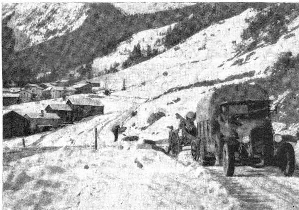
12-cm-Kanone auf einer Bergstraße Pièce de 12 cm sur une route de montagne

On a en général quelque peine à se faire à l'idée que nos canons lourds, autrement dit nos pièces de 120 mm, sont d'excellents canons de montagne, à condition toutefois que par une route carrossable on puisse les amener à pied d'œuvre. Leur trajectoire en effet assez élevée