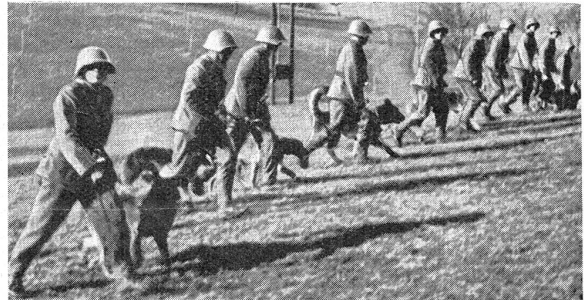
Meldehundeabteilung in Linie bei einer Gehorsamsprüfung (Marschübung). Equipe de chiens de liaison marchant en ligne à l'occasion d'un exercice d'obéissance.

Speziell auf kriegstechnischem Gebiete tastet der Laie ganz im finstern und schreitet in Ungewißheit, weil er nicht weiß, was mit seinen Lieben und seinem Besitz geschieht, wenn diese durch die allgewaltige Luftmacht feindlicher Staaten bedroht und gefährdet werden.