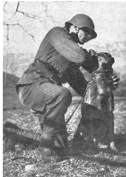
Beim Anziehen der Meldepatrone. La cartouche de liaison est fixée au cou du chien.

Der Ruf nach Befestigungen im Grenzgebiet beginnt sich zu erheben. Bekanntlich hat die Bundesversammlung in der Dezembersession 1933 einen Kredit von vorläufig 6 Millionen bewilligt, um im Rahmen des Arbeitsbeschaffungsprogramms mit der Vornahme von Befestigungsarbeiten einsetzen zu können. Die Vorarbeiten sollen nun beendet sein, so daß mit dem Bau der Werke begonnen werden könnte. Noch ist aber bis heute nichts darüber bekannt geworden, wann die ersten Spatenstiche erfolgen sollen. Daß sich eine gewisse Ungeduld und Besorgnis im Volke zeigt, ist angesichts der heutigen politischen Lage in Europa verständlich. Viele Tausende arbeitsloser Wehrmänner, die, wie wir hoffen, in erster Linie Berücksich-