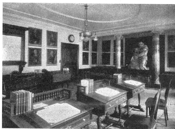
Der kleine Empiresaal des Reg.-Rates, Sitzungszimmer für die kantonalen Gerichte. Im Hintergrund das Kißling'sche Gipsmodell: „Wiedersehen Arnolds von Melchthal mit seinem gebiendeten Vater“, das leider zufolge Mangels der nötigen Finanzen nicht ausgeführt werden konnte.

L'Hôtel de ville, dans sa forme actuelle, date de