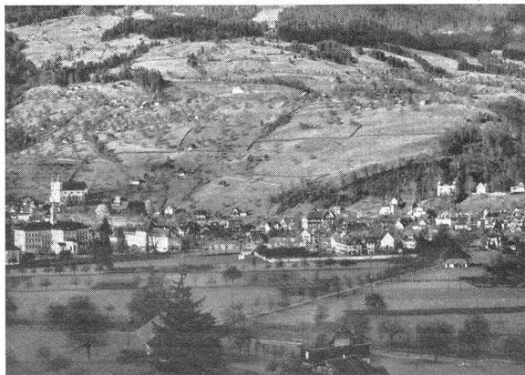
Sarnen mit Ramersberg.

Aber auch das am nördlichen Ausgang des Dorfes liegende «Heimat-Museum» mit seiner reichhaltigen Sammlung obwaldnerischer Kulturgüter darf der Be-