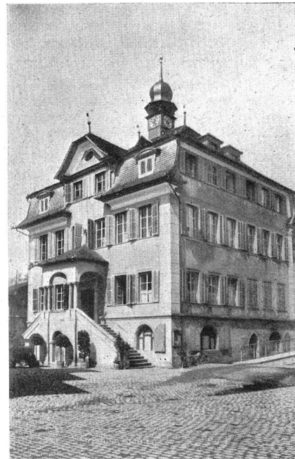
Rathaus von Sarnen.