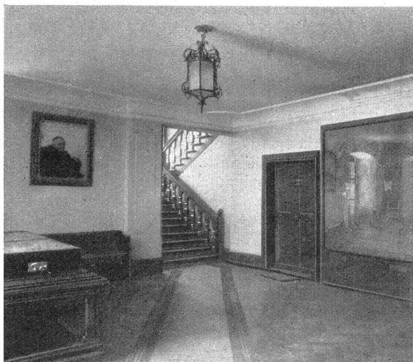
Das Vestibül, links ein Teil des wertvollen Reliefs der Zentralschweiz, oben das Gemälde: „Der Weltüberblicker“ (der volkstümliche bish. Kommissar und Schriftsteller J. Jg. von Ah), von Kunstmaler Ant. Stockmann. Wurde vom Bunde angekauft und hier deponiert.

Nous n'avons pas besoin d'orner le calme village au lac entouré de montagnes, laissons cette tâche au printemps et un pays ruisselant de couleurs et de fraîcheur nouvelle vous sourira, chers camarades! De loin la fière résidence vous salue avec le Landenberg sur lequel plane le souffle de l'histoire, avec la maison pittoresque du Stand, où chaque année depuis bientôt 300 ans, la Landsgemeinde se rassemble le dernier dimanche d'avril. Et puis, cher camarade, si tu peux disposer d'une petite heure pour la flânerie, ne manque pas alors de visiter là-haut les ruines du vieux château, détruit en ce mémorable matin de nouvel-an 1308, et dont l'histoire