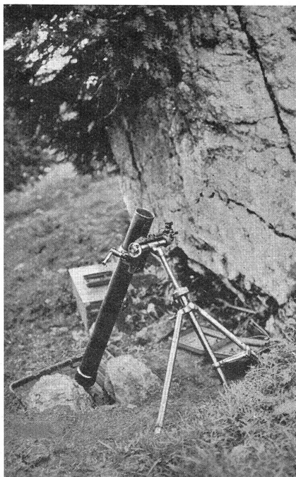
Fig. 6. Le mortier Stokes-Brandt de 81 mm, modèle 1930.

La précision ne laisse rien à désirer et la rapidité