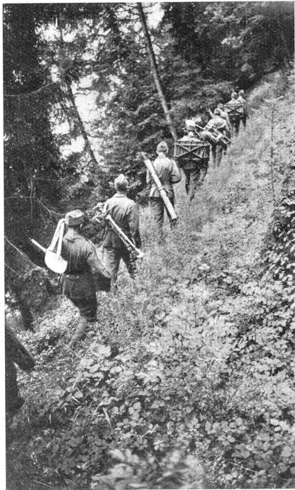
Fig. 12. Mortier de 81 mm transporté à dos d'homme au moyen de sangles.