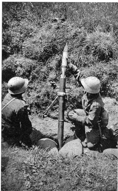
Fig. 7. Mortier en position dans un fossé. Le tireur s'apprête à laisser tomber dans le tube une mine à grande capacité. Le trait blanc sur le tube sert à mettre l'arme en direction au moyen du fil à plomb.

angle de chute provoque autour du point d'impact une gerbe circulaire d'éclats.