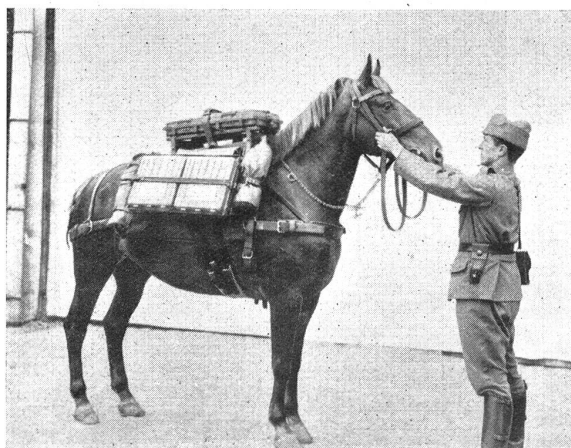
Fig. 10. Caissettes à munition bâties.

Si par contre le projectile tombe avec peine dans le tube, l'air ne peut pas s'échapper et en se comprimant freine le projectile et la cartouche ne frappant pas assez fort sur le percuteur ne peut s'enflammer.