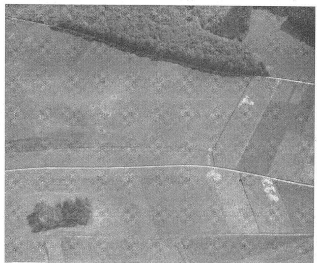
Aufnahme aus 600 m. Alle Stellungen sind besetzt. Außer den 5 erwähnten Stellungen erscheint hier eine Mg.-Stellung an der untern linken Ecke des kleinen Wäldchens. Gute Stellung, doch zu wenig mit Rasen getarnt, helle Erdflecken machen sie sichtbar.

der kameradschaftlichen Geselligkeit gewidmet war, wurde um Mitternacht zur Arbeit ausgerückt. Die zirka 60 Mann hatten in Arbeitsgruppen zu 6 Mann aufgeteilt Stellungen für 2 Maschinengewehre und 2 Lmg., sowie 4 mannstiefe Schützenester auszuheben. Die Arbeiten wurden im Schichtenbetrieb bei halbstündiger Ablösung mit requiriertem großem Schanzwerkzeug durchgeführt, wobei die Verwendung von künstlichem Licht (Taschenlampen usw.) nicht gestattet war. Die Anleitung zum Stellungsbau war einige Tage zuvor in einem instruierenden Lichtbildervortrag geboten worden. Trotz schwieriger Umstände (harter, steiniger Boden, kalte stürmische Witterung) machten die Arbeiten derart Fortschritte, daß bei Tagesanbruch die Stellungen besetzt werden konnten. Das Hauptgewicht war gelegt auf tiefes, enges Graben in unregelmäßigen Formen und auf zweckmäßiges Tarnen. Zur Tarnung kam mangels jeglicher Geländebedeckung einzig die Verwendung von Rasenziegeln in Frage. Die Tarnung gegen Fliegersicht wurde in Form eines Wettbewerbes unter den einzelnen Gruppen der Geschicklichkeit der Leute überlassen.