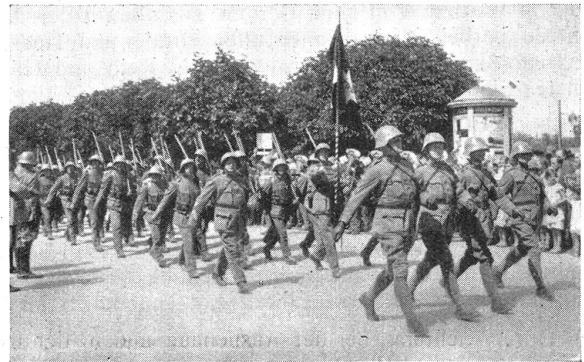
Lw. I.-R. 45 im W.-K. 1934. Defilee in Burgdorf. Phot. Hch. Hohl, Arch R. I. Lw. 45 au C. R. 1934. Le défilé à Berthoud

Die ersten Versuche dieser Untersuchungsart, die sich ganz besonders gegen die Tuberkuloseerkrankung richtet, datieren aus dem Jahre 1923. Durchleuchtungseinrichtungen sind seit 1931 an allen größern Waffenplätzen aufgestellt und seit drei Jahren in Betrieb. Man ist sich bewußt, daß man mit den Durchleuchtungen niemals jeden krankhaften Prozeß erfassen kann, man hofft aber aus der Zusammenarbeit mit den Ergebnissen der Schulkinderdurchleuchtungen eine ärztliche Vorgeschichte zu erhalten, da die persönlichen Aufschlüsse der zur Untersuchung Kommenden häufig im Stiche lassen. « Aus