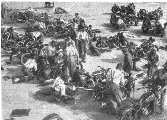
Motorisierte Mg.-Kp. — Beim Parkdienst der Motorradfahrer Cp. de mitr. motorisée. — Les motocyclistes au service de parc

Die Bündner sind stolz darauf, daß zur Zeit drei ihrer engern Landsleute den Grad eines Oberstdivisionsnars bekleiden. Es ist dies ein Zeichen, daß noch heute