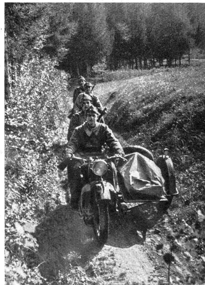
Motorisierte Mg.-Kp. Fahrübung einer Abt. motorisierter Mg. in schwierigem Gelände Cp. de mitr. motorisée. — Un détachement de mitr. motorisé effectuant un exercice de conduite en terrain difficile

Dann war der fremde Kriegsdienst auch eine Ausbildungsgelegenheit für die Fälle, da das Vaterland geschulte Soldaten benötigte. Der Freistaat der Drei Bünde unterhielt nämlich keine Armee, sondern rief von Fall zu Fall die Fähnlein des Bundes, bzw. der Hochgerichte unter die Waffen. Da war es ein willkommener Umstand, daß viele der Aufgebotenen in fremden Kriegsdiensten sich mit der Handhabung der Waffen vertraut gemacht hatten, und daß die pensionierten Offiziere fremder Ar-