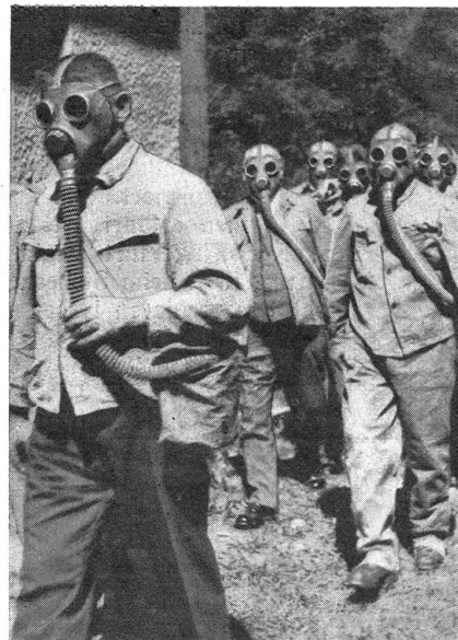
Der Marsch nach der Gaszelle. Hier wird die definitive Kontrolle der Gasdichtigkeit der Maske vorgenommen. Die Gaszelle ist mit dem harmlosen Tränengas „vergast“ und unrichtiges Anpassen der Gasmasken wird bald entdeckt

En route pour la cabine à gaz. Ici l'imperméabilité du masque contre les gaz est définitivement contrôlée; la cabine à gaz est „gazée“ avec du gaz lacrymogène inoffensif, et une fixation incorrecte du masque est bientôt découverte