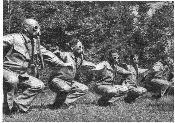
Selbst während ermüdender Arbeit ist die Behinderung durch die Gasmaske durchaus erträglich und hat keinen wesentlichen Einfluß auf die Dauer der Widerstandskraft des Gasmaskenträgers. Même pendant un travail fatigant, la gêne causée par le port du masque est tout à fait supportable et n'a pas d'influence marquée sur la durée de la force de résistance du porteur du masque.

Gleichsam eine Ergänzung zu diesen Nachrichten bildet ein redaktioneller Artikel in der « Neuen Aargauer Zeitung ». Danach soll es ein offenes Geheimnis sein, daß Ende Juli Oesterreich und Italien unmittelbar vor dem Abschluß einer Militärkonvention standen, die eine weitgehende Zusammenarbeit auf militärischem Gebiet zur Folge gehabt und Oesterreich vollends Italien ausgeliefert hätte. Beim geplanten Besuch des österreichischen Bundeskanzlers in Riccione hätte die Konvention unterzeichnet werden sollen. Die Ereignisse des 25. Juli machten aber einen dicken Strich durch die Rechnung. Wohl ging der neue Kanzler Dr. Schuschnigg nach Florenz