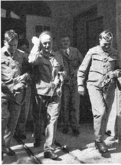
Um die hervorragenden Eigenschaften unserer Gasmasken in einfacher Weise zu demonstrieren und jedem das nötige Zutrauen zu ihr einzuflöschen, genügt es, in dieser tränengasverseuchten Zelle die Gasmasken abnehmen zu lassen. Pustend und reibend steht man bald einmal draußen. Pour démontrer de la façon la plus simple les grandes qualités de notre masque contre les gaz et pour que chacun lui fasse confiance, il suffit d'entrer dans cette cabine infectée de gaz lacrymogène et d'enlever le masque. Le larmoiement est alors tel qu'on est obligé de quitter immédiatement la cabine.

ken. Italien war bereit, sofort in Oesterreich einzumarschieren, für den Fall einer nationalsozialistischen Erhebung oder eines Einmarsches der österreichischen Legion aus Deutschland. Italien soll während der Februarunruhen Oesterreich auch mit Waffen- und Munitionslieferungen unterstützt haben. Eigenartig wirkte es beispielsweise, daß Teile der Wiener Polizei mit italienischen Stahlhelmen ausgerüstet waren. Seit dieser Zeit ist dann die militärische Einflußnahme immer deutlicher geworden. In Tirol und in Kärnten wurden häufig italienische Offiziere in Zivil bei Rekognoszierungen beobachtet, auf dem Arlberg sah man sie gar Vermessungen vornehmen. Im Mai rekognoszierte der Korpskommandant von Bozen selbst mit seinem Stab unter österreichischer Führung von Landeck bis Feldkirch. Als dann am 25. Juli Bundeskanzler Dollfuß ermordet wurde, hat Italien wiederum gewaltige Truppenmassen im Raume von Tarvis und am Brenner konzentriert. Wie man aus unbedingt zuverlässigen Quellen erfährt, hat am 27. Juli der italienische Konsul in Klagenfurt zweimal bei der Kärntner Landesregierung bzw. beim Sicherheitsdirektor angefragt, ob er nicht « marschieren lassen solle; man