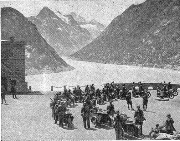
Motorradfahrer-Kolonne beim Grimselospiz. Colonne de motocyclistes à l'hospice du Grimsel.

umschwärmt und von Ratten zernagt der Verwesung verfiel, suchte der Krieger Trost und Hoffnung im Kreuze. Im Kriegsfall läßt sich das Schicksal durch Zweifel ohnehin nicht zerstören. Nur voll des Glaubens und der Hoffnung kann man vorwärtsschreitend die Straßen des Todes passieren.