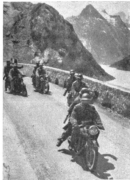
Motorradfahrer-Rekruten bei der Abfahrt vom Grimselospiz. Recrues motocyclistes descendant depuis l'hospice du Grimsel.

Für alle unsere braven Kämpfer, einerlei ob Infanterie oder Artillerie, gab es nur eine einzige Nachschubstraße und diese führte durch den Ort Quero. Alles mußte durch Quero; die Munition, die Verpflegung und jeder weitere Kriegsbedarf, aber auch die Verwundeten, die aus der Front zurückbefördert wurden. Im Gewehrfeuertrag des Feindes war ein Passieren Queros bei Tag überhaupt ausgeschlossen. Nur bei Nacht konnte