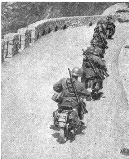
Talfahrt auf der Grimselstraße. Descente dans la vallée par la route du Grimsel.

Breit lag vor uns der Monte Tomba (Grabberg),