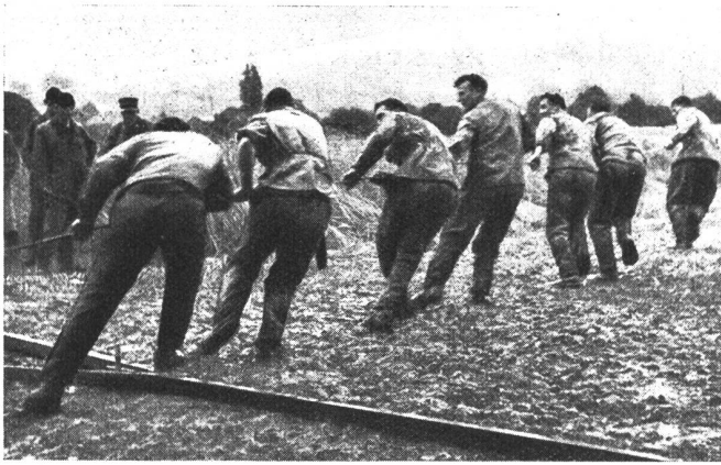
Beim Einziehen des Drahtkabels der Bootsfähre. Retrait du câble du bateau-bac.

Posa del cavo metallico lungo il tragitto.