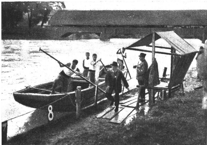
Ponton bei der Landung auf bestimmte Ziele. Un ponton aborde à l'endroit voulu. Pontoni di sbarco in punti designati.

vereins; an jenem nahmen 12 nach Pontonier-Kompanien oder -Bataillonen zusammengestellte Mannschaften teil.