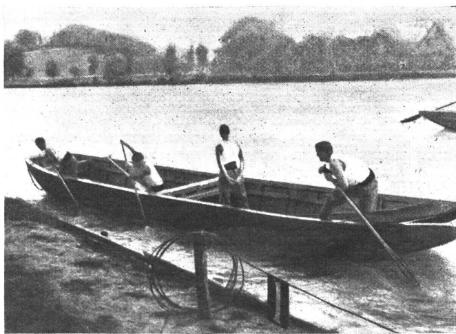
Stachelarbeit flußaufwärts. Travaux de barbelés en amont du fleuve. Lavoro d'asta per rimontare la corrente.

In Olten fand Ende Juni ein Jugendtag für den Frieden statt. Neben den kommunistischen Veranstaltern nahmen daran protestantische und katholische Jugendgruppen teil, deren «Friedensbekenntnis» in der Abstimmung dann natürlich durch die kommunistische Mehrheit in passendem Sinne geformt wurde. Der Weltfriede will von diesen hinter den Ohren noch feuchten Jungen und Mädels erreicht werden durch das Mittel der Hetze. Der Jugendtag verurteilte die Politik des Bundesrates wegen Vertragsbruch, begangen durch die Aufhebung der Sanktionen und wegen Verfassungsverletzung durch Schaffung von Luftschutzbestimmungen auf dem dringlichen Wege des Bundesbeschlusses. Wie werden unsere sieben geplagten Mannen in Bern niedergeschlagen und zerknirscht gewesen sein, als sie von diesem doch sicher maßgebenden Urteil über ihr Tun und Lassen durch die weisen Jüngelchen hörten! Für den Herbst ist in Genf ein Weltfriedenskongreß geplant, wiederum kommunistisch aufgezogen. Die Verehrer des blutrünstigen Russenregiments sind ja die berufensten und qualifiziertesten Hüter des Friedens. *