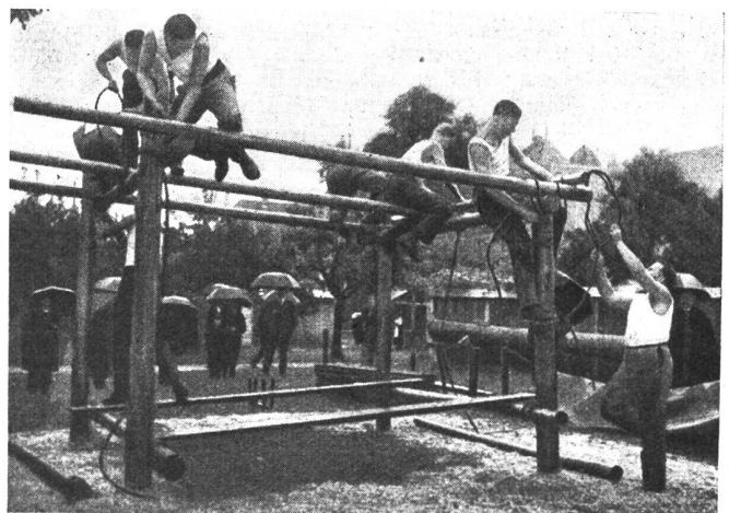
Beim Gruppenwettkampf für Seilverbindungen. Concours de groupes pour nœuds de cordage. Gara di gruppo nel collegamento con corde.

Unsere Infanteriekanone ist eine Tankabwehrwaffe. Die Ika kann auch gegen Maschinengewehre usw. Verwendung finden. Es werden dann Langgranaten mit Momentanzünder verschossen. — Das Schießen auf Tanks braucht sehr viel Uebung, also sehr viel Munition. Somit sind die Ausbildungskosten der Ika-Kanoniere entsprechend große.