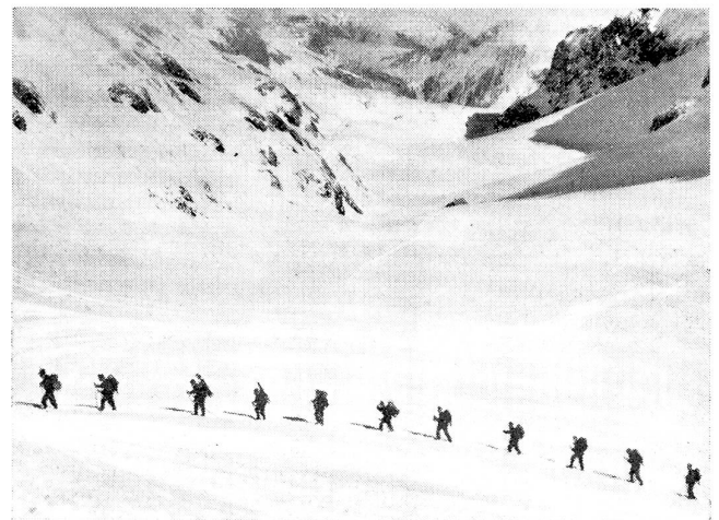
Mg.-Gruppe im Aufstieg durch das Iffigental nach dem Wildhorn. Groupe de mitr. en marche pour le Wildhorn par le wallon d'Iffigen. Gruppo mitraglieri in marcia per il Wildhorn, attraverso l'Iffigental.

Das Buch ist erfüllt von einem geradezu fanatischen Glauben an den Sieg und an die Gewalt der Maschine. Aber hinter der Maschine muß der kämpferische Wille des Menschen stehen, sein Genie, seine Nervenkraft. Es gibt eine technische Phantasie, die mehr überborden kann, als die Phantasie eines Dichters. In diesem geistvollen Buche wird die Maschine vergottet und der Mensch entseelt. Nicht der Mensch, der die Maschine