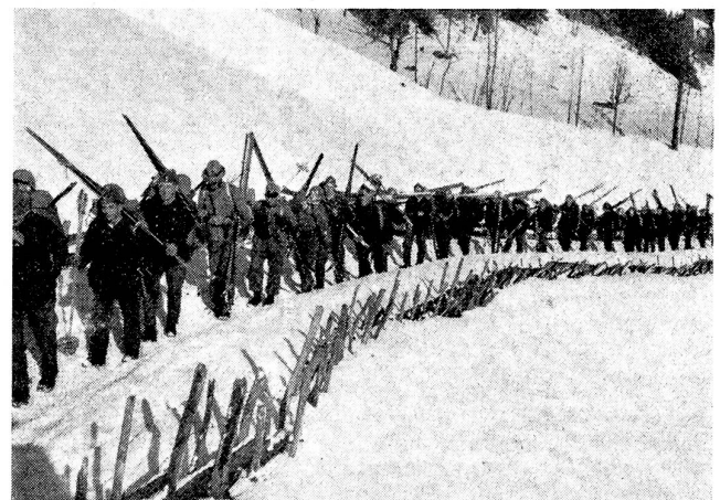
Fußmarsch der Kompanie nach Pöschenried-Iffigenalp. Marche de la compagnie en direction de Pöschenried-Iffigenalp. La compagnia marcia verso Pöschenried-Iffigenalp.

Die rote Armee Sowjet-Rußlands hat von ihrer bisherigen Eigenart wieder ein Stück aufgegeben durch die Wiedereinführung der Grußpflicht. Das gesamte Dienstreglement ist stark verschärft worden, um Zustände zu beseitigen, die mit dem