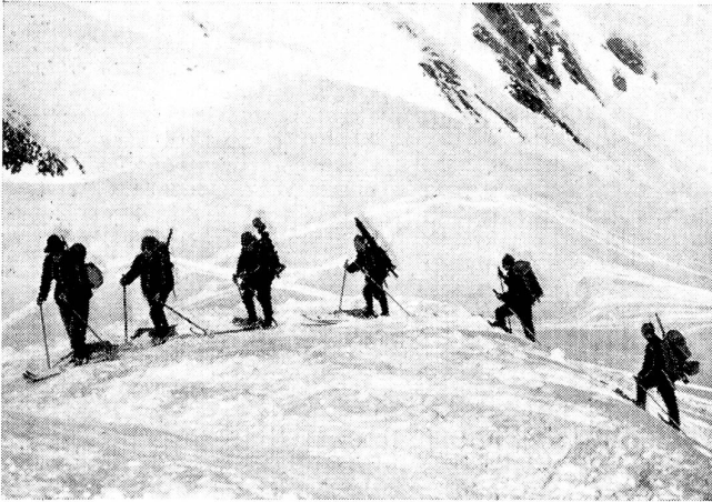
Mg.-Trupp im Aufstieg zum Schneidejoch. Mitrailleurs en marche pour le Schneidejoch. Gruppo in marcia verso Schneidejoch.

Wesen eines Heeres im Widerspruch stehen. Die roten Machthaber scheinen sich davon überzeugt zu haben, daß ohne strengste Disziplin und Unterordnung, ohne Respekt und Achtung vor den Vorgesetzten Kriegsgenügen unerreichbar ist.