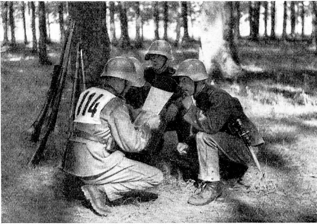
Patrouillenlauf. Unteroffiziers-Patrouille beim Studium der ihr gestellten Aufgabe.

Course de patrouilles. Patrouille de sous-officiers étudiant la tâche reçue.