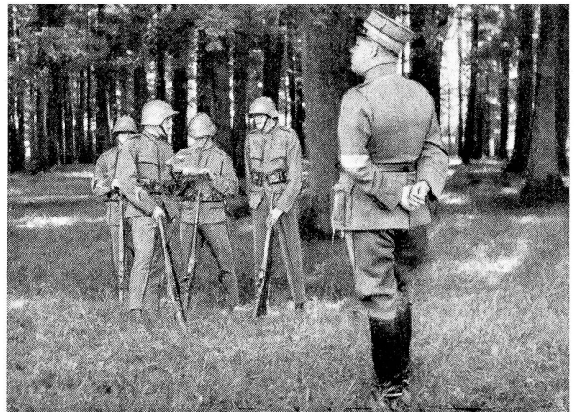
Patrouillenlauf. Vor Abgang der Patrouille hatte deren Führer seine Patrouilleure in Anwesenheit der Kampfrichter über die erhaltene Aufgabe zu orientieren. Diese Orientierung sowohl, wie auch die anschließende Befehlserteilung durch den Patrouillenführer fiel bereits unter die Bewertung durch die Kampfrichter.

Im Laufe dieses Monats haben Sitzungen und Besichtigungen der Kommissionen des National- und Ständerates für die Vorlage über die weitere Verwendung des Wehranleihfonds