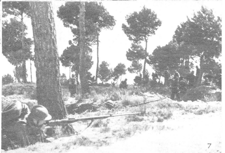
Die spanisch-republikanische Armee L'armée espagnole républicaine L'armata repubblicana spagnuola