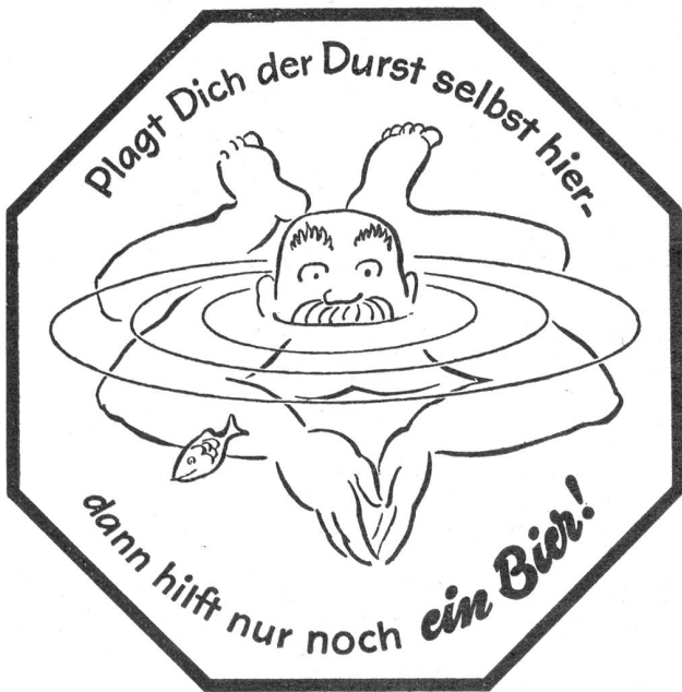
Jaggi + Wüthrich

Zürichsee r. Ufer. 13./14. Aug. 1938 Teilnahme an der Jubiläumstagung in Glarus: Abfahrt ab Meilen, 1404, Glarus an 1546. — Wir ersuchen alle Kameraden um prompte Einlösung der Nachnahme des «Schweizer Soldat», welche anfangs September nächsthin vorgewiesen wird.