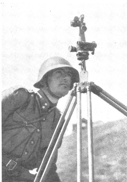
Offizier einer Feldhaubitzbatterie beim Einrichten der Batterie mit dem Batterie-Richtkreis.

und Leutnant. Nach drei Jahren Oberleutnant, 1901 Hauptmann, 1908 Major im Generalstab, 1915 Oberstlt. und 1920 Oberst. Als Subalternoffizier dient er bei den Luzerner Bat. 43 und 45 und dann als Div.-Adj. in der alten 5. Div. Im Stabe der 8. Inf.-Brigade wirkt er als Major im Generalstab. Wieder zur Infanterie versetzt, kommandiert er das Bat. 42, dann die Inf.-Mitr.-Abt. 6 und bis 1915 das Fest.-Inf.-Bat. 87. Im weitern sieht man ihn an der Spitze des Thurgauer Rgt. 31 und von 1920 bis 1926 als Führer der Inf.-Br. 16 (Thurgauer, St. Galler, Glarner). Im Jahre 1925 manövriert er mit der sog. leichten 6. Div. im Abschnitt Kreuzlingen-Amriswil-Bischofszell. Damit beendet er seine Dienstperiode als Truppenführer. Sehr fruchtbar gestaltete sich Oberst Webers Tätigkeit auch während der Jahre 1918—1920 als Kdt. der freiwilligen Bewachungstruppe und in der Folge auch der Heerespolizei. Aus diesen so verschiedenartigen Kontingenten von über 15,000 Mann schuf er