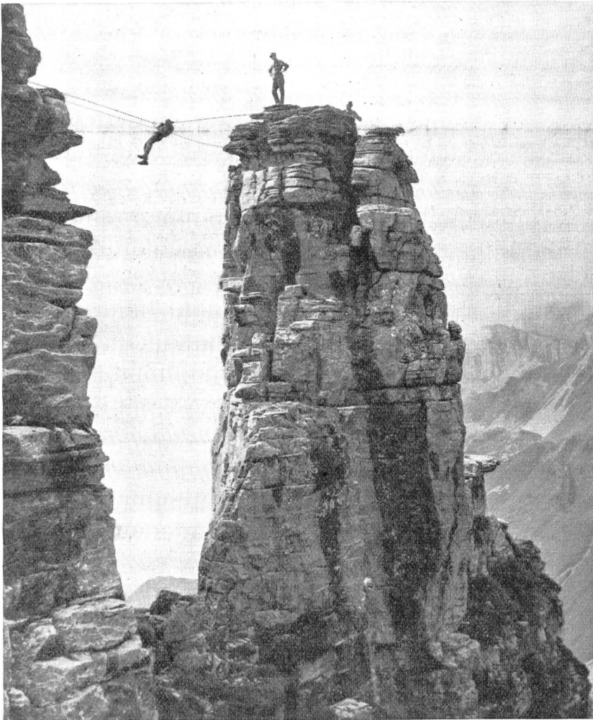
Seilarbeit am Felssturm. — Travail à la corde dans le rocher. — Lavori in corda sulle guglie alpine. (Z.-Nr. VI B 8791.)

Verwendungsart a) konnte im Ernste von den Russen nie angewendet werden. Die wenigen Maschinen, die in Fernflügen von Oesel, Hangö oder Dagoe aus Berlin bzw. die Peripherie Groß-Berlins erreichten und dann in aller Hast und ohne zu zielen sich ihrer Bombenlast entledigten, können wohl kaum als «Hammerschläge» im Sinne der RAF bewertet werden. Ebenso wenig die Bombardierungen von Constanza und Ploesti. Diese beiden rumänischen Städte waren zu nah der Front, als daß sie im strategischen Sinne als feindliches Hinterland gelten konnten. Was es mit den russischen Fallschirmabspringern auf sich hat, die angeblich in Bulgarien abgesetzt wurden, kann noch nicht völlig abgeklärt werden. Sowohl aber das eine wie das andere hat mit einer selbständigen und planmäßigen Vernichtungsaktion der Roten Luftflotte gegen die Lebenszentren des feindlichen Hinterlandes nichts zu tun. Dieser Mißerfolg ist aber keineswegs auf ein Unvermögen der russischen