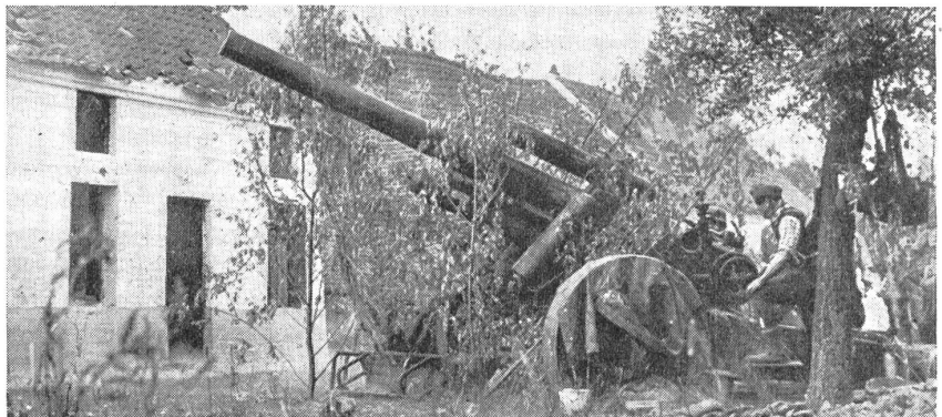
Die Spreizlafette erlaubt ein sehr breites seitliches Richtfeld; d. h. das Rohr kann nach der Seite hin und her verschoben werden, ohne daß das Geschütz mit dem Lafettenschweif herumgeschwenkt werden muß. — L'affût en flèche permet de très grands changements de dérive sans que l'on soit obligé de faire pivoter la pièce. La bouche à feu seule change de direction selon les nécessités du tir. — L'affusto a gambe divaricabili permette un campo di tiro laterale molto vasto, poichè la canna può venir spinta da una parte all'altra senza che la coda dell'affusto venga essa pure spostata.