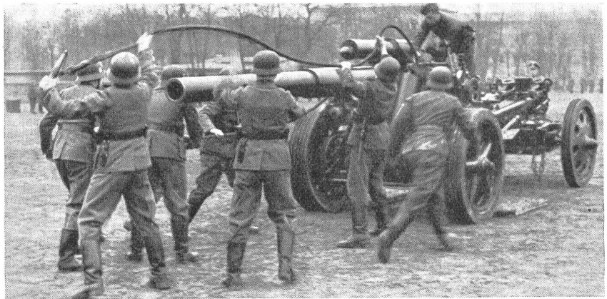
Zur Erstellung der Schußbereitschaft wird das Rohr aus der Fahrstellung auf die Lafette in die Rohrrücklaufschiene gezogen. — Lors de la mise en position de tir, la bouche à feu est glissée sur l'affût et le berceau. — Per la prontezza di tiro la canna è levata dalla posizione di traino sull'affusto.

Das Gesamtbild artilleristischer Wirkung im neuen Krieg durfte demnach damit charakterisiert sein: einem mittelschweren, motorisierten Feldgeschütz fiel die Hauptlast des artilleristischen Kampfes zu. Wo raschere und namentlich schwerste Wirkung sehr früh gesucht wurde, trat die Luftwaffe in die