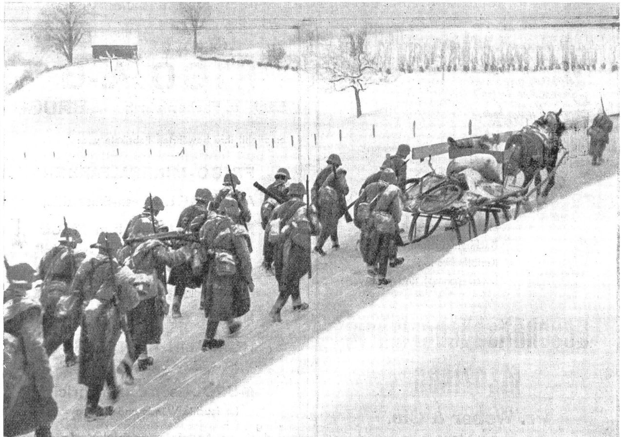
Mühsamer Wintermarsch, Requisitionsschlitten sind an Stelle der Ordonnanzfuhrwerke getreten. — Pénible marche d'hiver, les traîneaux réquisitionnés ont remplacé les fourgons d'ordonnance. — Faticosa marcia durante l'inverno. Le slitte requisite sostituiscono i furgoni. (Zens.-Nr. VI Br 823).