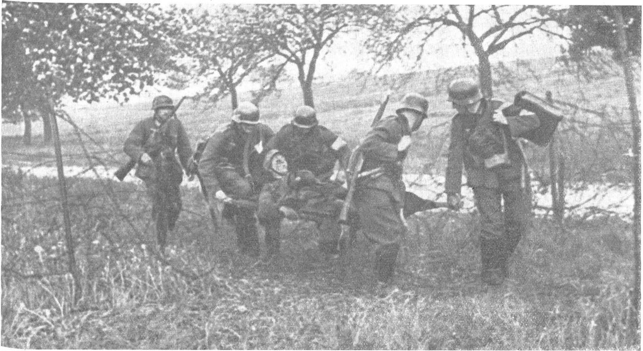
Deutsche Sanitätssoldaten, unterstützt von 2 Infanteristen, beim Rücktransport eines Verwundeten. Der deutsche Sanitätssoldat ist an seiner breiten Rotkreuzarmbinde von weitem erkennbar. — Soldats sanitaires allemands, protégés par deux fantassins, assurant la relève et le transport d'un blessé. Le sd. sanit. allemand est reconnaissable de loin grâce au large brassard avec croix-rouge qu'il porte au bras. — Soldati sanitari tedeschi, protetti da due fucilieri, trasportano un ferito. Il soldato sanitario tedesco è molto facilmente riconoscibile anche da lontano grazie alla sua larga fascia della Croce Rossa, che reca al braccio.