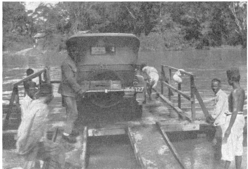
Brücken sind in Sumatra noch eine Seltenheit; auf Pontonfähren werden die Flüsse überquert. — Les ponts sont encore très rares à Sumatra; c'est au moyen de bacs que l'on traverse les fleuves. — In Sumatra i ponti sono ancora una rarità: i fiumi sono superati mediante traghetti a zattera.

Das Eigenartige dieses ausgesprochen subtropischen Landes ist, daß es mit einer echten Tannensorte bewachsen ist, die hier auf dem vulkanischen Aschenboden bis auf eine Höhe von 2000 m ü. M. noch prächtig gedeiht. Durch diese Vegetation gerade erhält das Land einen besonderen, man möchte fast sagen schweizerischen Charakter, besonders da auch noch verschiedene Alpenrosensorten vorhanden sind. Ein herrliches, kühles Klima, für die ausgetrockneten, hitzeversengten Tropenleute eine wahre Wohltat, trotzdem das ganze Jahr hindurch fast ein Tag nach dem andern in prächtigstem Sonnenschein erstrahlt; der Schrecken aller schweizerischen Fremdenorte, trostlose Regenperioden von zwei, drei und mehr Tagen, kommen hier nicht vor.