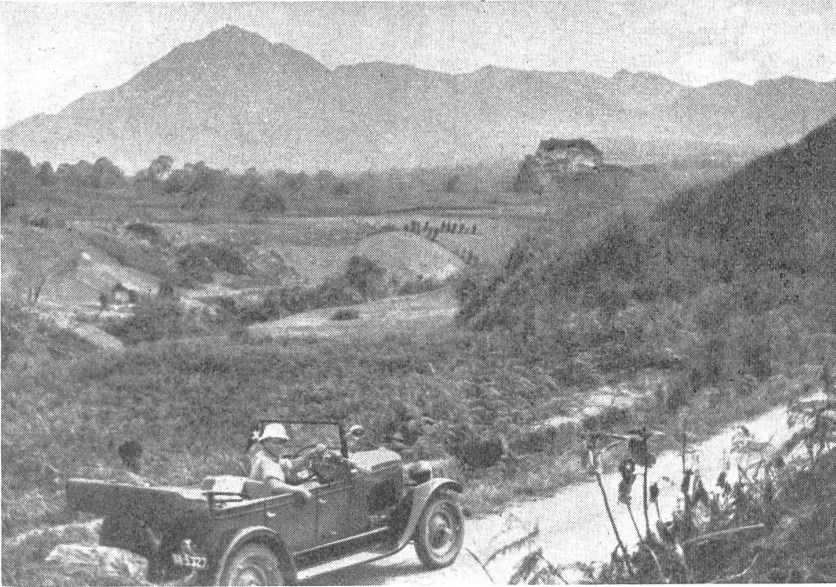
Gajoelandschaft auf Sumatra mit ausgedehnten Reispflanzungen. Im Hintergrund das Massiv des 3000 m hohen Telong. — Plantations de riz à Sumatra. A l'arrière plan le massif de Telong, altitude 3000 m. — Paesaggio gajoese a Sumatra con estese piantagioni di riso. Sullo sfondo il massiccio di 3000 m. del Telong.

Durch den Ausbruch des Krieges im fernen Pacific sind auch die holländischen Kolonien in den Kampf hineingezogen worden. Die wichtigste holländische Kolonialinsel Sumatra liegt mit ihrer Ost- und Nordostküste in unmittelbarer Nachbarschaft des größten englischen Stützpunktes im Osten, der Festung Singapur und dürfte vermutlich über kurz oder lang mit ihrem nördlichen Teil zum engeren Kriegsgebiet zählen.