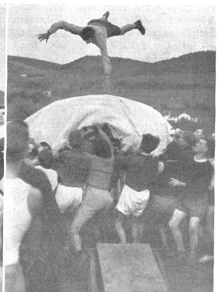
Antritt einer kurzen Luftreise. — Début d'un court voyage aérien. — Inizio di un breve viaggio aereo. (Zens.-Nr. N M 8134.)