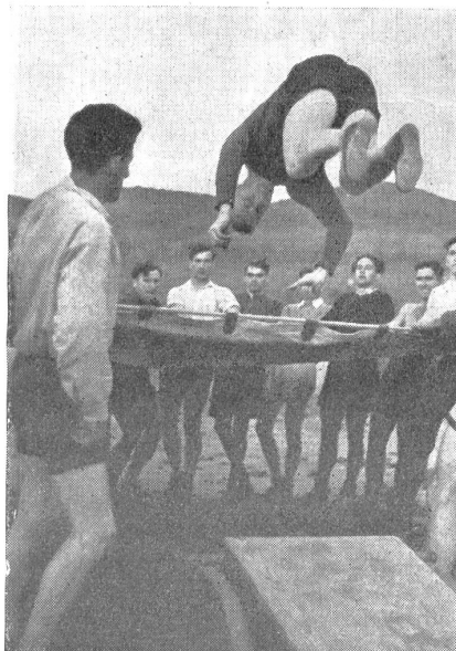
Ueber das Federsprungbrett auf das Sprungtuch. — Saut dans la toile de sauvetage. — Salto sul telo di salvataggio. (Zens.-Nr. N M 8133.)