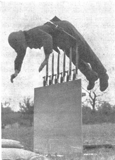
Hechtrolle über Bajonettspitzen. — Saut de poisson par-dessus les pointes de baionnettes. — Salto del pesce sopra la punta delle baionette. (Zens.-Nr. N M 8132.)

Mutsprünge gehören auch zur Nahkampf Ausbildung, und es ist keine Spielerei, wenn man heute in Bildreportagen Sprünge in Kiesgruben, über Bajonette oder über Drahtwalzen sieht, nein im Gegenteil, es braucht viel Mut und Körperbeherrschung, um solche Sprünge auszuführen. Mit Ueberrollen wird die Beweglichkeit, das leichte Fallen dem Soldaten beigebracht. Hierauf folgt die Hechtrolle über 3—10 Mann, dann über Drahtwalzen, Gewehre mit aufgepflanztem Bajonett sowie über Hindernisse im Gelände.