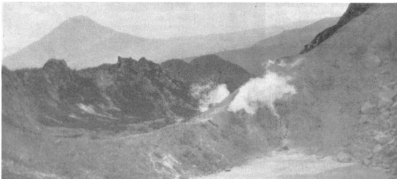
Im Gipfelkrater eines erloschenen Vulkans auf Sumatra. — Au sommet du cratère d'un volcan éteint à Sumatra. — Nel cratere superiore di un vulcano spento dell'isola di Sumatra.

und durch den beginnenden Verkehr — besonders das Auto wird als großes Pazifizierungsmittel betrachtet — hofft man langsam den Haß der Eingeborenen dämpfen und erlöschen lassen zu können. All dies klingt nun recht gefährlich und auch wenig ver-