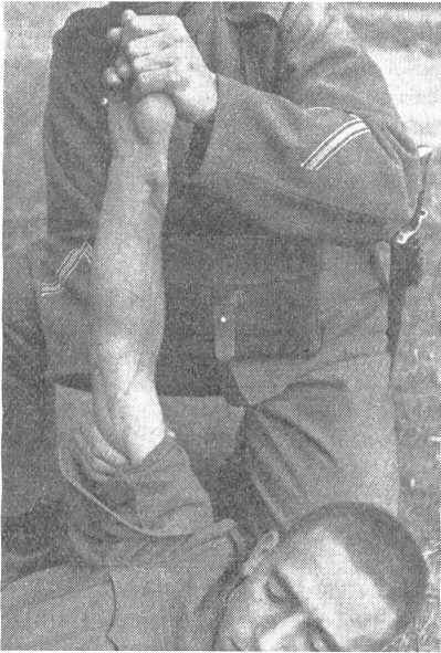
Bild 1. Hochheben des verletzten Armes und Zudrücken der Schlagader herzwärts der Wunde. — Maintien en l'air du bras blessé et pression de l'artère entre la plaie et le cœur. — Massima elevazione del braccio ferito e pressione sulle arterie: direzione della ferita verso il cuore. (Zensur-Nr. N M 7324.)

terbauch an herzwärts. In diesen Ausnahmefällen, sowie gelegentlich am Hals, ist unter Umständen, da dabei oft höchste Lebensgefahr besteht, das direkte Eingehen mit einem - sauberen - Finger, ev. dem Daumen, in die Wun-