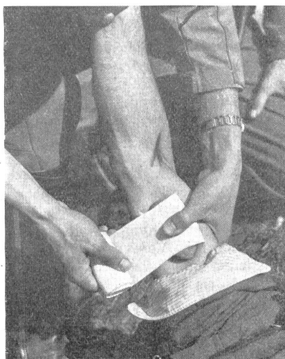
Bild 7, rechts: Anlegen des keimfreien Wundverbandes auf die Schußwunde. — A droite: Pose d'un pansement stérilisé sur une blessure de balle. — A destra: Applicazione di un bendaggio sterile sulla ferita di un'arma da fuoco. (Z.-Nr. N M 7319.)