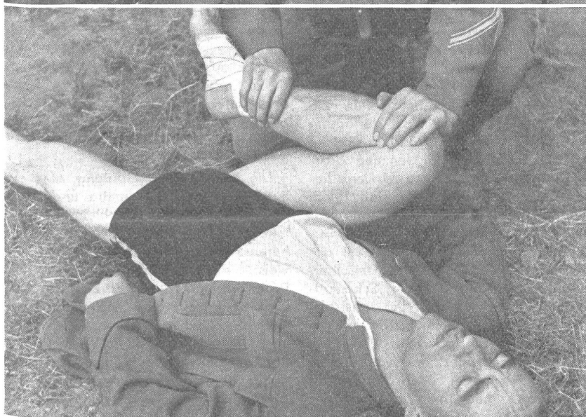
Bild 5. Stilllegung einer Schlagaderblutung aus der rechten Kniekehle durch extreme Beugung des Beines. — Arrêt de l'hémorragie d'un vaisseau du jarret droit par flexion forcée de la jambe sur la cuisse. — Emostasi di una emorragia della fossa poplitea del ginocchio destro con flessione estrema della gamba. (Zens.-Nr. N M 7334.)

wenigen Jahren die Ansicht, daß sie, nur am Oberarm oder Oberschenkel angelegt, wirksam sei, während am Vorderarm und Unterschenkel sich damit wegen der Möglichkeit eines Ausweichens der Blutgefäße zwischen die zwei dortigen Knochen nicht viel erreichen lasse. Die Erfahrung hat aber gezeigt, daß das nicht stimmt und daß auch am Vorderarm und Unterschenkel vorgenommene Umschnürungen so wirksam sind wie irgend andere. Es gilt danach heute der Grundsatz, daß die Umschnürung immer zirka handbreit herzwärts der Verletzungsstelle erfolgen soll.