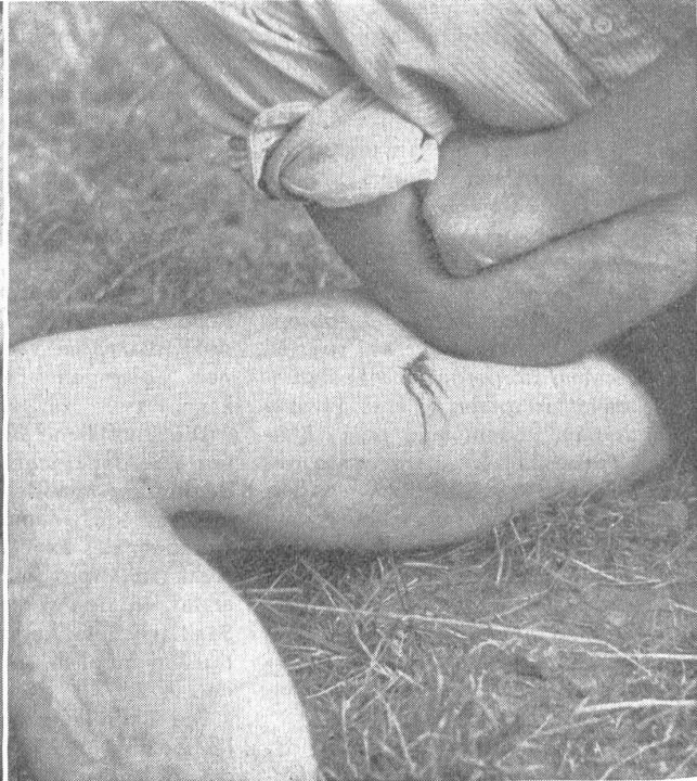
Bild 3. Hauptschlagader-Verletzung am rechten Oberschenkel: Zudrücken mittels Ellenbogendruck. — Blessure d'un vaisseau important de la cuisse droite: pression au moyen du coude. — Aorta, ferita alla coscia destra: premere con il gomito. (Zensur-Nr. N M 7331.)