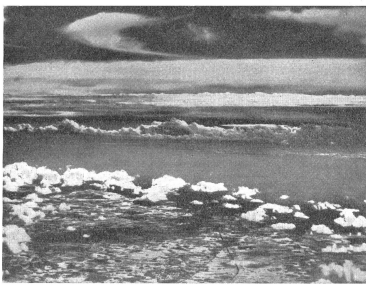
Inferior-Aufnahme der französischen Küste von England aus; Standort des Flugzeuges über der Grafschaft Kent, Höhe 6000 Meter. — Vue de la côte française prise d'Angleterre par un avion volant au-dessus du Comté de Kent, à l'altitude de 6000 m. Photo infrarouge della costa francese dall'Inghilterra presa da aereo sopra la contea di Kent; altitudine 6000 m.