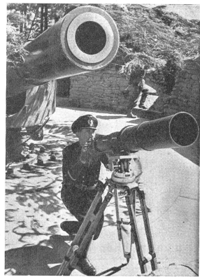
Rechts: Die Fernkamera, mit welcher die obenstehende Aufnahme gemacht wurde. Die Positionierung der Kamera zum Geschützrohr erfolgte offenbar nur aus Originalität, für die Aufnahme selbst wird die Kamera selbstverständlich ohne Elevationsrichtung auf das Ziel eingestellt. — A droite: La parallélisme de la caméra avec le tube du canon est ici une fantaisie car, pour la prise de vue elle-même, l'appareil est pointé sans élévation sur l'objectif à photographier. — A sinistra: Il teleobiettivo, col quale si fece la fotografia qui sopra. La posizione dell'obiettivo, parallelo alla canna del pezzo, venne probabilmente soltanto come una cosa originale; per la presa stessa l'apparecchio venne regolato direttamente sull'obiettivo, naturalmente senza elevazione.