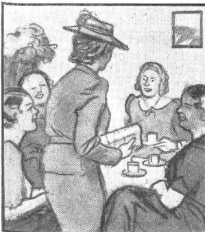
„Ich muss gehen, sonst komme ich zu spät zur Chorprobe.“ — „Nimm Dich in Acht, es weht ein rechter Grippewind.“

On ne saurait assez rappeler à cette heure-ci ces judicieuses considérations. Dans le cadre de notre défense natio-