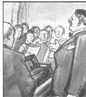
„Ich freue mich, dass wir vollzählig versammelt sind und hoffentlich alle gut bei Stimme. Haben Sie meinen Rat befolgt?“