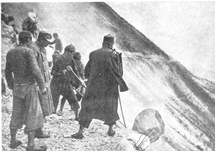
Chinesisches Straßenunterhaltsdetachment bei Reparaturen an der Burmastraße. — Détachement d'entretien de routes chinois effectuant des réparations sur la route de Rangoon à Tschungking. — Distaccamento di manutenzione stradale cinese al lavoro sulla strada di Burma.

— einem Knotenpunkte, wo sich drei Straßen nach dem Grenzorte Bhamo und der Grenze Chinas vereinigen. Weiter führt dann die so umkämpfte Burmastraße östlich nach Yunnanfu, der Hauptstadt der chinesischen Provinz Jünnan. In dieser 150,000 Einwohner zählenden Stadt liegt auch der Endpunkt der von Hanoi in Französisch-Indochina kommenden wichtigen Eisenbahn. Dann aber verläuft die Burmastraße in nordöstlicher Richtung nach Tschungking an der Mündung des Kialingking in den Yangtsekiang. Diese große Stadt mit mehr als einer Million Bewohner besitzt einen der wichtigsten Flugplätze. Von dieser Hauptstadt des Reiches Tschiang-Kai-Scheks führen heute noch die lebenswichtigsten Fäden nach Britisch-Burma — die nächsten Stunden bereits können zeigen, ob es dem stürmischen Drängen der Japaner gelingen wird, auch diesen ausschlaggebenden Platz zu erobern, die Verbindung mit China und Britisch-Indien völlig abzuriegeln. P. Schulthef,