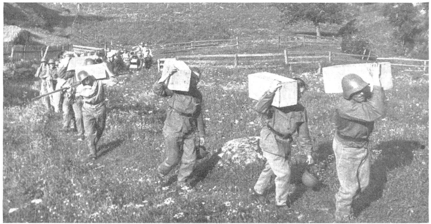
Mineure beim Sprengmaterialtransport. — Mineurs transportant du matériel de mines. — Minatori al trasporto di materiale esplosivo. (Zensur-Nr. VI R 10169.)

det werden. Ihr Mechanismus ist dabei so einzustellen, daß er vom Feinde ungewollt (Druck, Zug) ausgelöst wird.