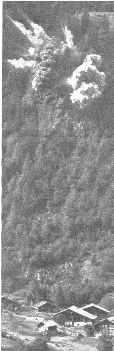
Explosion einer bedienten Mine. — Explosion d'une mine. — Esplosione di una mina.

Hauptsache ein Stellungskrieg war, den Kampf mit unterirdischen Minen gegen befestigte Stellungen, denen nicht anders beizukommen war, verstand, hat heute, im Zeitalter des Bewegungskrieges auch der Minenkrieg seine Bedeutung geändert, und sich der raschen Bewegung angepaßt. Die tief unter dem Boden liegenden Minen haben den nur knapp unter Erdoberfläche liegenden Minen Platz gemacht. Für die früheren unterirdischen Minen , die die Zerstörung der feindlichen Stellung bezweckten, mußten oft sehr lange Minengänge gebaut werden, bis die Ladung angebracht und nach sehr starker Verdämmung zur Explosion gebracht werden konnte. Vom Gegner wurden, um das Anbringen der Minen zu verhindern, Gegenstellen vorgetrieben, die ihm das Abhören der feindlichen Arbeit und das Anbringen von Gegenminen zum Abquetschen der Minengänge gestatteten. Dieser Kampf unter der Erde wurde im letzten Weltkrieg, nach Erstarrung der Fronten, auf kilometerlangen Geländeabschnitten geführt. Meist dauerte es dabei Monate bis ein Minengang fertig erstellt und der Sprengstoff zur Explosion gebracht werden konnte.