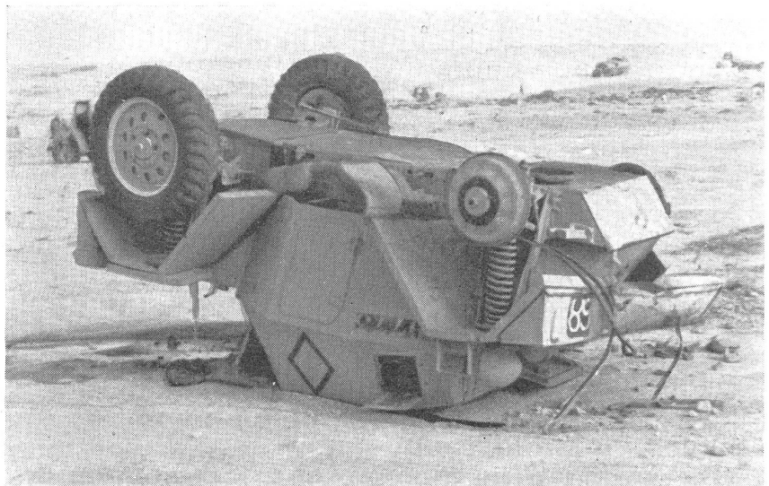
Wirkung einer Tankmine auf einen leichten Panzer-Aufklärungswagen. — Effet d'une mine anticar sur un char léger d'exploration. — Effetto di una mina anticarro su un carro armato leggero da ricognizione.

Deutscher Minensuchtrupp in Frankreich an der Arbeit während des Feldzuges 1940; der Mann rechts trägt eine ausgegrabene und gesicherte französische Tellermine. — Equipe allemande de détecteurs de mines au travail en France pendant la campagne de 1940; l'homme de droite porte une mine française qui vient d'être déterrée et assurée. — Squadra tedesca cercamine in Francia al lavoro durante la campagna 1940; l'uomo a destra porta una mina francese levata dal suolo e assicurata.