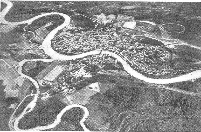
Fairbanks, die Hauptstadt Alaskas am Delta-River. — Fairbanks, la capitale de l'Alaska sur le River-Delta. — Fairbanks, capitale dell'Alaska al delta del River.

Quellströmen des Yukon genommen werden. Jack London erzählt in seinen Goldgräbergeschichten (er war selbst längere Zeit hier oben) wie die Schneestürme über den Chilcootpaß und den Teiya brausten, auch das ganze Leben schilderte der amerikanische «Karl May» sehr lebendig, und da seine Bücher weitverbreitet sind, können wir es uns ersparen, davon zu berichten. Hier soll vielmehr nun auf die