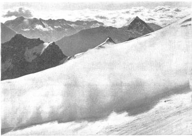
Rechtzeitiges Erkennen und Vermeiden der alpinen Gefahren und die Eignung, diese Gefahren auch überwinden zu können, gehört mit zu den Fähigkeiten, die der Gebirgsdienst von den Führern aller Grade fordert. Bild: Abbruch einer Eislawina über eine wichtige Aufstiegsroute. — Savoir déceler et éviter à temps les dangers alpins, au besoin même les surmonter, fait partie des qualités que doivent posséder les chefs de tous grades appelés à servir en haute montagne. Cliché: Déclenchement d'une avalanche sur une voie d'ascension importante. — Fra le qualità che un capo di ogni grado deve possedere per il servizio in montagna, vi è anche quella di saper riconoscere ed evitare per tempo i pericoli alpini, e di saperli sommontare. Figura: Rottura di una valanga di ghiaccio su una salita importante. (Z.-Nr. VI Br 4947.)