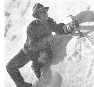
Sichern im Fimhang: gespannt und wachsam Augen wird des Vorrücken des Seilkameraden verfolgt. — La montée du camarade de cordée sur le névé fortement incliné est assurée et suivie avec attention. — Sicurezza nel pendio verso la cima: l'occhio vigile e attento segue l'avanzata del camerata in cordata. (Z.-Nr. VI Br 4943.)