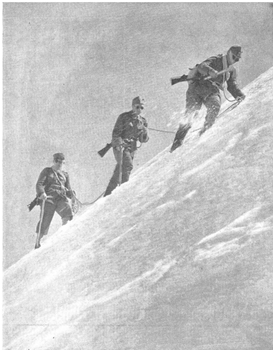
Geschlossenes Traversieren eines Firnstellhanges von 70° Neigung. — Traversée en ordre serré d'un névé d'une inclinaison de 70°. — Attraversamento in ordine chiuso di una cresta ripida con 70° di pendenza. (Z.-Nr. VI Br 4945.)