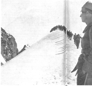
Übungsmärsch über eine Firnkette: je schmaler die Spalten, desto größer die Marschdisziplin und um so schwerer wird es der feindlichen Luft zu trotzen. — Exercice de marche sur une arête: plus la trace est étroite, plus la discipline de marche est grande, et d'autant plus sera-t-il difficile à l'observation aérienne de lier de ces traces dans la neige des conclusions quant à l'effectif de la troupe. — Esercizio di marcia su una cresta: più stretta è la pista, meglio dev'essere la disciplina di marcia e più difficile anche sottrarsi alla vista del nemico. (Z.-Nr. VI Br 4947.)