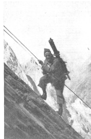
Steiler Aufstieg im Felsen: Zur Sicherung und Erleichterung der schweren Waffentransporte werden an besonders schwierigen Stellen feste Seile angebracht. — Ascension dans le rocher: afin d'assurer et de faciliter les lourds transports d'armes, des cordes fixes sont placées aux endroits particulièrement difficiles. — Salita ripida su roccia: per assicurare ed alleggerire il trasporto delle armi pesanti, in luoghi particolarmente difficili vengono applicate delle corde di sostegno. (Z.-Nr. VI Br 4956.)