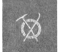
In Härte erworben — mit Stolz getragen. — Acquis durement — fièrement porté. — Guedegnato con dure fatica — portato con fierezza.