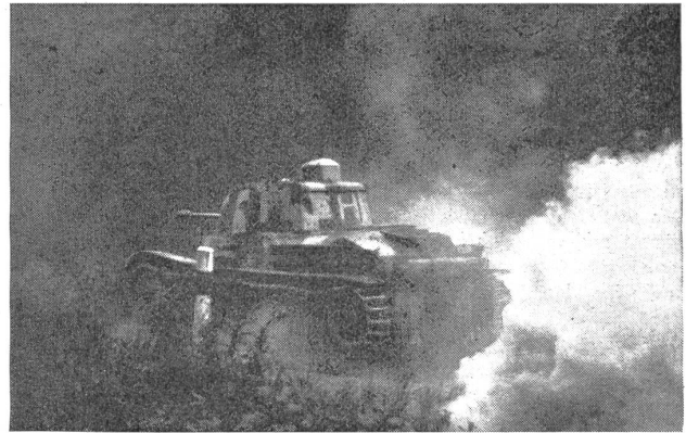
Rauchkerzen (rechts) und eine vorbereitete Sprengung (links) knapp vor dem Panzerwagen haben diesen zum Stehen gebracht. — Une boîte à fumée (à droite) et une explosion préparée (à gauche) ont arrêté un tank. — Candele fumogene (a destra) ed una distruzione preparata (a sinistra) sono riuscite a fermare il carro armato avversario. (Z.-Nr. N/V/10031.)