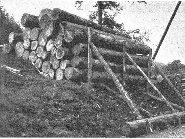
Vorbereitetes improvisiertes Tankhindernis, durch Sprengung der Verstrebungen werden die Baumstämme die Straße versperrt. — Obstacle anti-tank improvisé: un barrage de troncs d'arbres est provoqué par explosion. — Ostacolo anticarro improvvisato preparato; i tronchi d'albero sbarreranno la strada. (Z.-Nr. N/V/10039.)