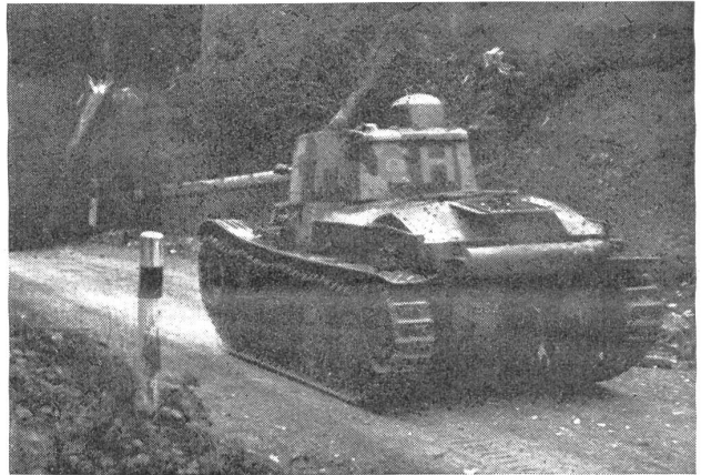
Die Durchfahrt ist durch die gesprengten mächtigen Tannen vorerst gesperrt, im Nahkampf wird der Panzerwagen nun erledigt. — Grâce aux sapins abattus, le passage est barré. Le tank est alors attaqué et neutralisé en combat rapproché. — Il passaggio del carro armato viene dapprima sbarrato mediante esplosione degli abeti giganti; poi con la lotta ravvicinata il carro sarà liquidato. (Z.-Nr. N/V/10029.)