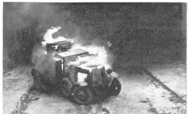
In Brand geschossener Panzer-Aufklärungswagen. — Char blindé d'exploration en flammes. — Carro armato da ricognizione messo in fiamme.