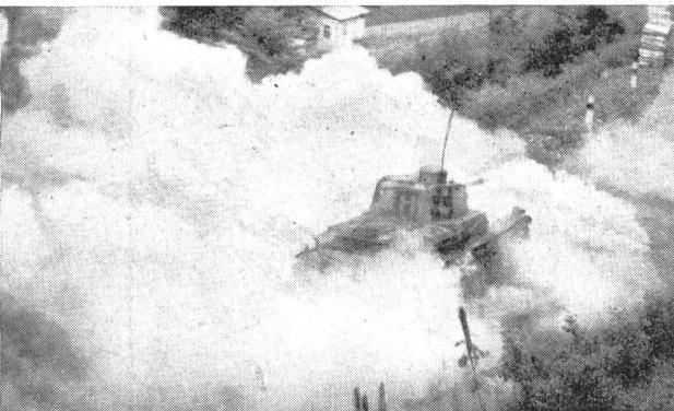
Durch künstliche Nebelwand zum Stehen gebrachter Panzerwagen. ein Augenblicksziel für Panzerbekämpfungspatrouillen. — Tank réduit à l'immobilité au moyen de brouillard artificiel. Il est ainsi vulnérable à l'attaque d'une patrouille anti-tank. — Carro armato che è stato obbligato a fermarsi da una cortina di nebbia artificiale; esso costituisce così un buon obiettivo per le pattuglie anticarro. (Z.-Nr. N/V/10031a.)