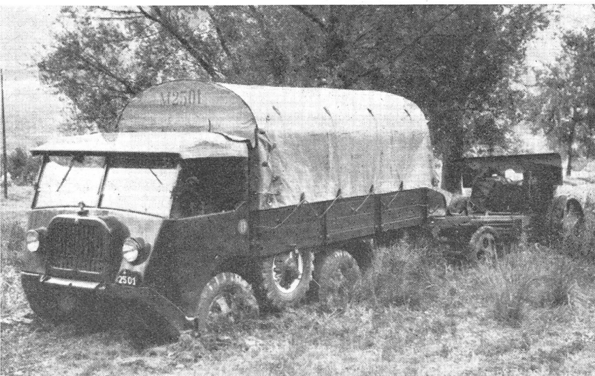
Geschützzug im Morast. Nur ein geländegängiges Fahrzeug wird in solchen Fällen die über 3 Tonnen schwere Motorkanone sicher in die befohlene Feuerstellung bringen. (Zensur-Nr. VI Vi 11635.)

schütze in die Stellungen zu ziehen, wird heute wohl kaum mehr in Frage kommen und darf gar nicht mehr verlangt werden. Der leitende Offizier muß heute soweit sein, daß er diese Auf-