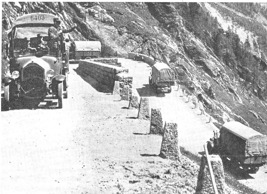
Kolonnenfahren mit befohlenen Abständen, ein Prüfstein für die Fahrdisziplin der Motorfahrer. (Zensur-Nr. VI Vi 11624.)

Der Nachschub von Betriebsstoffen und Gefäßen, der Ersatzteile und Fahrzeuge muß ebenso geübt werden, wie das Nachbringen der Munition. Auch hier müssen Uebungen angesetzt werden, die kriegsmäßig durchzuspielen sind. Man setze deshalb taktische Ue-