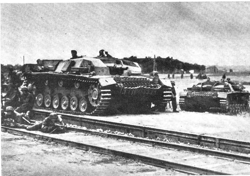
Deutsche Sturmgeschütze (turmlose Panzer) als Begleitartillerie.

Einsatz im Verhältnis zum erreichten Erfolg! Auch der Angriff gegen Jugoslawien war gewissermaßen ad hoc organisiert, da man deutscherseits ja gar nicht damit rechnete, mit diesem Staat in den Krieg zu kommen. Völlige Bereitschaft ließ aber diese Operationen gelingen, während serbischerseits tiefgehende Desorganisation jede planmäßige Verteidigung verunmöglichte. Um die Strategie des Ueberfalls mit Erfolg durchzuführen, wird der Angreifer alle seine Angriffsvorbereitungen verschleiern und seine Pläne geheimhalten. Der Anzugreifende wird eingeschläfert, um nachher desto gründlicher überrascht zu werden. Die Operationen gegen die Alliierten im Westen 1940 und gegen Rußland 1941 sind in dieser Beziehung Musterbeispiele größter strategischer «Tarnung». In der Regel wurden die ersten Ausgangsräume nahezu kampflos besetzt und in ihnen sofort der Nachschub durchgeschleust, um den begonnenen Angriff mit Wucht und Schwung fortsetzen zu können. Luftlandetruppen und Fallschirmjäger wurden im feindlichen Hinterland, an strategisch wichtigen Punkten, abgesetzt, mit dem Auftrag, diese Punkte zu besetzen und zu halten, bis die eigene Angriffsspitze sich mit ihnen vereinigen konnte. Ferner wird danach getrachtet, Objekte von lebenswichtiger Bedeutung (Elektrizitätswerke, industrielle Unternehmen usw.) möglichst rasch und unversehrt in die eigenen Hände zu bringen, um sie nach erfolgter Okkupation des Landes sofort wieder in Betrieb zu setzen. Die Voraus-