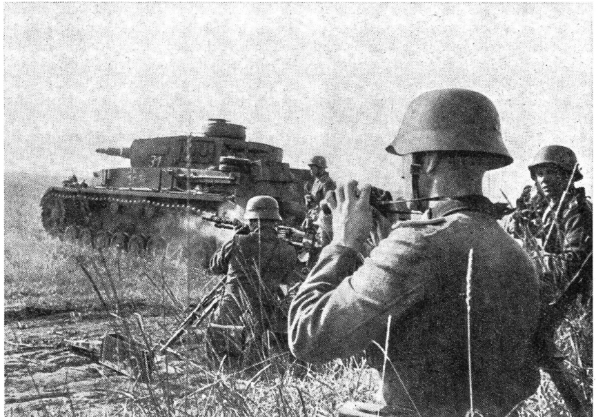
Schwerer Panzer und Panzergrenadiere im sprungweisen wechselseitigen Vorgehen.

Die letzten Ereignisse im Kriegsgeschehen beweisen mit Nachdruck die Feststellung, daß ein Angreifer bei seinen Aktionen nach Möglichkeit den Weg des geringsten Widerstandes einzuschlagen sucht, um damit den Gegner bereits in den ersten Phasen des Krieges vernichtend schlagen zu können. Inwieweit die Theorie des geringsten Widerstandes überhaupt anwendbar ist, entscheidet wohl die militärische und moralische Bereitschaft des anzugreifenden «Opfers». Ist der zukünftige Gegner durch die Propaganda, durch Zersetzung und Spionage