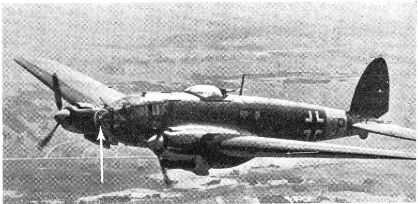
Bugkanzel-Mg.-Stand. Bei Flugzeugen ohne Mittelmotor sind an dessen Stelle in der Regel durchsichtige Bugkuppel eingebaut, die bei Kampfflugzeugen (Bombern) mit nach allen Seiten schwenkbaren Flugzeugkanonen oder Mgs. bewaffnet sind. Diese Waffen beherrschen den Feuerraum vorwärts und zum Teil auch seitwärts.