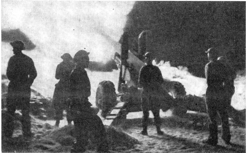
Der Krieg in Tunesien. Mittleres englisches Geschütz im nächtlichen Feuergefecht auf deutsche Verteidigungsstellungen.