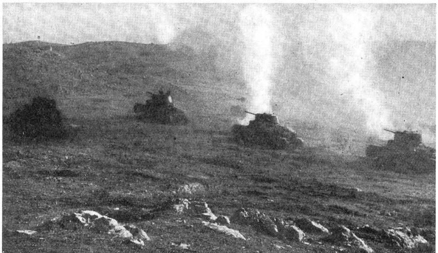
Der Krieg in Tunesien. Mittlere italienische Panzerkampfwagen im Gegenangriff im Hügelland Südtuniens.

Suppe, Fleisch und Brot, oh, wie das die Lebensgeister stärkt! Habt Dank, Kameraden, und kommt morgen nicht so spät.