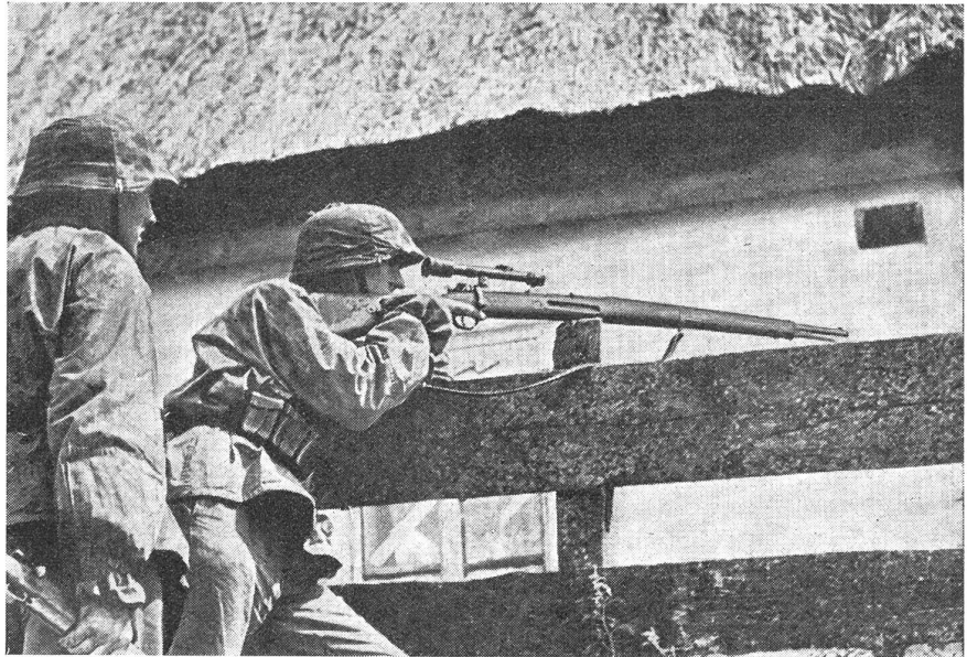
Deutscher SS-Scharfschütze im Ortskampf.

dem überraschten Gegner auf günstigste Entfernung mit dem ersten Schuß den Garaus zu machen. Nicht minder wichtig ist es aber auch, daß er lernt, «fakirgleich», wohlgetarnt in Anschlagbereitschaft stundenlang abzuwarten, bis ein lohnendes Ziel in seinem Blickfeld auftaucht.