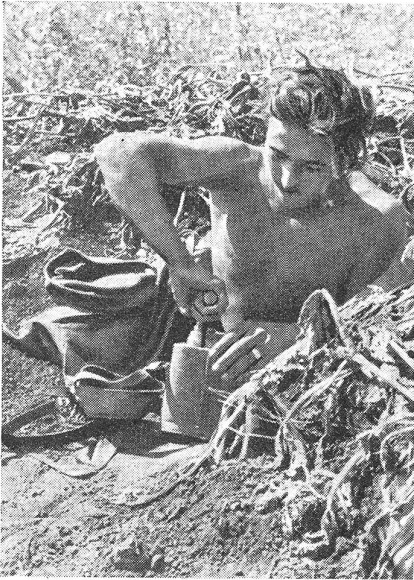
Die Auslösung der Nebelwerfer erfolgt batterieweise elektrisch durch Kontaktgerät.

re praktische Schußweite dieses Wersers einen Einsatz, der wesentlich näher an der Kampflinie liegt und auch eine wesentlich geringere Fläche, in die eine Batterie wirken kann. Dieser Nachteil wird aber teilweise durch die große Beweglichkeit der Nebelbatterien aufgehoben, die rasch ihre Stellungen wechseln können und zufolge der kürzeren Verbindungen zwischen den Beobachtungsstellen und den Waffenstellungen rasch schußbereit sind. Die größte Schwierigkeit dürfte die Bereitstellung genügender Munitionsmengen in den weit vorn liegenden Stellungen bedeuten; eine Schwierigkeit, die aber durch die Verwendung geländegängiger Fahrzeuge für den Munitionsnachschub weitgehend behoben sein dürfte.