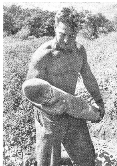
Raketen-Granate des deutschen Nebelwerfers; der untere Teil (rechts des hinteren Führungsringes) dürfte den Raketenatz enthalten.

Der Nebelwerfer besteht aus einer leichten Spreizlafette, ähnlich derjeni-