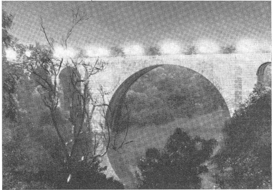
Nahwirkung einer amerikanischen Leuchtbombe: die Brückenbeleuchtung selbst ist nicht so hell wie die von der Leuchtbombe bestrahlten Brückenpfeiler.

Diese neuere Erfindung auf dem Gebiete der photographischen Luftbildtechnik ist gekennzeichnet durch eine einfache Bedienungsart und eine au-