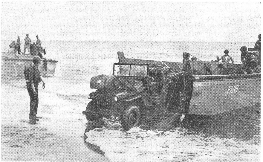
Amerikanische Panzerkähne bei einer Landungsoperation. Ein «Jeep» verläßt eben den Panzerkahn.

Von den alliierten Nationen heute benutzten Amphibienkampfwagen sind