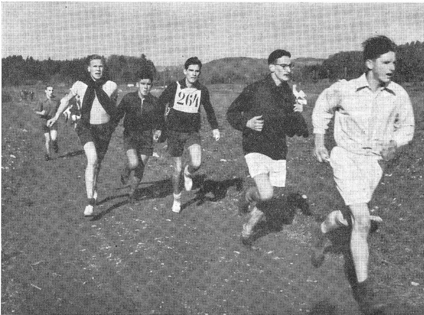
Zäh und verbissen wird um die Siegerehre gerungen. (VI 13908.)

Mädchengruppen — Kameradinnen aus dem FHD. oder die jungen, unternehmungslustigen Pfadi von Küsnacht — sich begeistert mit ihren Kameraden messen.