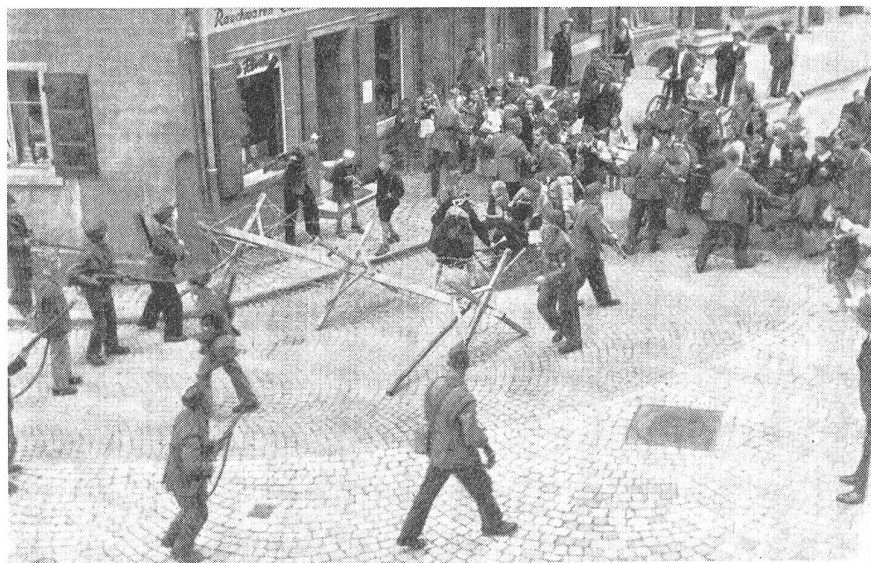
Jede Ortswehr hat eine einsetzende Evakuierung und Abwanderung zu verhindern. Hier schreitet die O.W. ein, schließt alle Dorfausgänge durch Barrikaden ab und bewacht dieselben. Im Dorf und in den Quartieren trifft man dann in solchen Lagen O.W.Ueberwachungspatrouillen an. (15702/5.)

Die Zahl der Ausbildungssof. reichte aber nicht aus, um die Ausbildung in allen O.W. zu leiten, so daß diese Of. auch auf das Können der O.W.Kdt. und O.W.Gr. angewiesen waren. Speziell das Können der O.W.Gr. war sehr bescheiden, da diese bisher nie eine besondere Grf.-Ausbildung er-