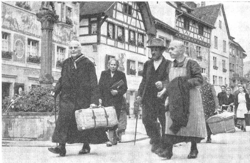
Bei einer Kriegsmobilmachung wird nicht evakuiert. Die Bevölkerung darf nicht abwandern wie es dieses Bild zeigt. (15702/11.)

Bedenkt man, daß es Ter.Kreise gibt, die mehrere hundert O.W. aufweisen, so begreift man auch, daß die Ter.-Kdt. ganz auf die Reg.Kdt. angewiesen waren und dadurch persönlich beinahe gar keine direkte Einwirkung auf die Ausbildung der O.W. haben konnten. Da die Reg.Kdt. seit vielen Jah-