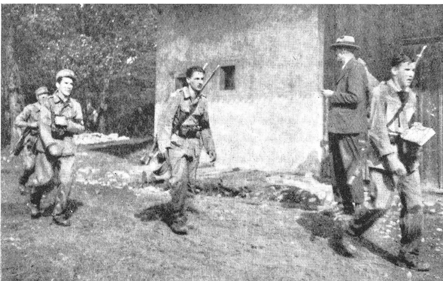
Junge O.W.Soldaten bei einem Orientierungslauf. (15702/9.)

Im Jahre 1942 bestanden die Reg.- und O.W.Kdt. wieder einen dreitägigen Ausbildungskurs. Nach diesem Kurse hatten die O.W.Kdt. unter Aufsicht der Rg.Kdt. in den O.W. die Handhabung der Waffe, das Einsetzen der Tankbarrikaden, den Wachtdienst usw. zu üben und speziell die Einsatzaufgaben durchzuexerzieren. Der Wunsch nach vermehrten Uebungen mit der Truppe zwecks praktischer Erprobung des Gelernten ging leider nicht in Erfüllung, da man allgemein die O.W. nicht anerkannte. Da und dort zeigten sich sogar deutlich Abneigungen gegen die O.W., und man konnte öfters kritische Worte hören über den ungenügenden Ausbildungsstand und die Verwendung derselben. Man äußerte ziemlich laut, daß die O.W.-Leute ja nicht einmal laden und entladen können. Bei dieser Beurteilung vergaß man aber voll und ganz, daß die meisten O.W.-Leute nie eine Rekrutenschule bestanden haben, und daß es sogar sehr viele O.W.Kdt. gibt, welche nie Soldat waren. Man vergaß auch, daß die O.W.-Leute bisher nie Manipulierpatronen oder blinde Patronen zur Verfügung hatten, um das Laden und das Entladen mit Patronen üben zu können. Wenn dann da und dort in einer O.W. das Laden und Entladen mit scharfer Munition auf dem Turnplatz in Gegenwart einer Schar Kinder geübt wurde, so stellten die Kritiker das gefährliche Spielen mit scharfer Munition fest und waren der