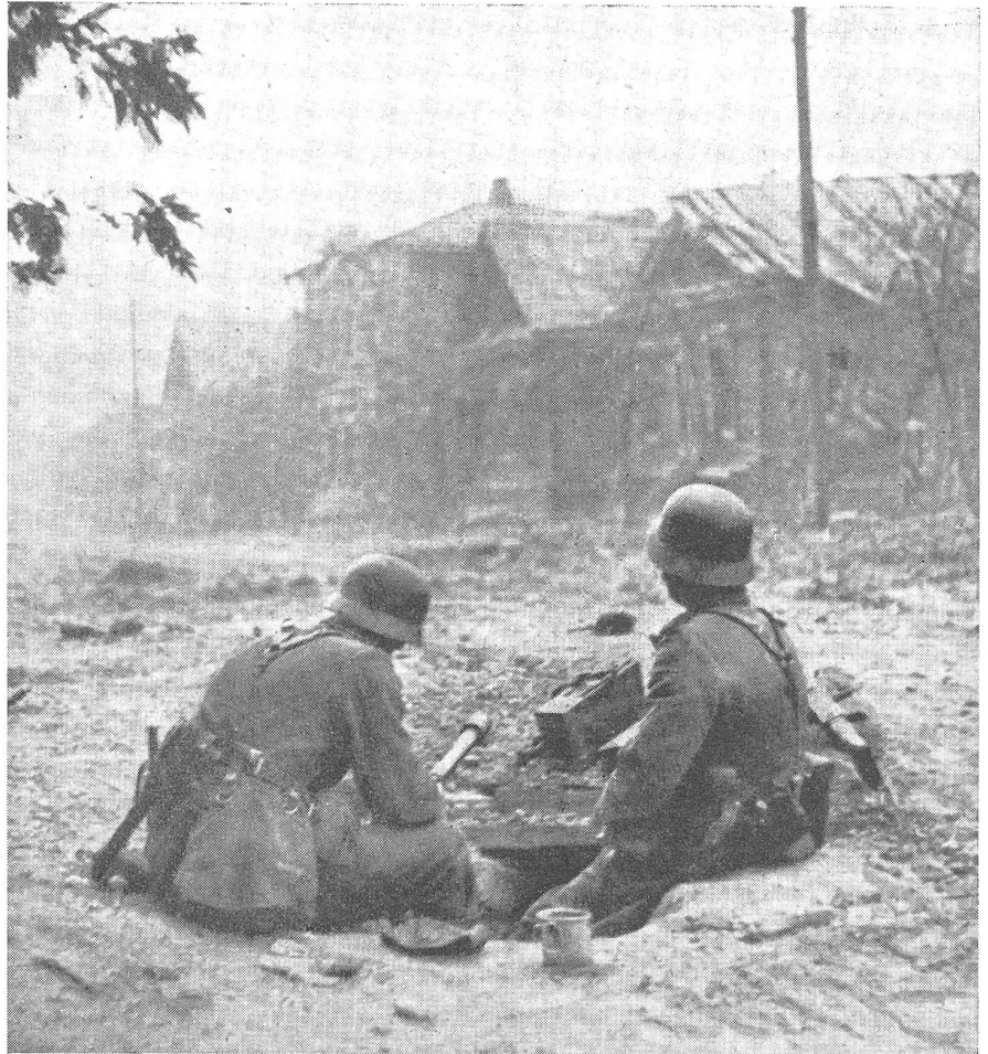
Deutscher Sicherungsposten in einer Vorstadt von Stalingrad.

Am 1. Februar 1943 meldete Moskau die Liquidierung des zentralen Teiles der in Stalingrad eingekesselten Gruppe der deutschen Armee. Gefangengenommen wurden Generalfeldmarschall Paulus (seither ist jegliche Spur von ihm verschwunden!), mehrere Korps- und Divisionskommandanten. Die Nordgruppe unter der Führung des Generals Strecker behauptete sich immer noch. Am 2. Februar wurde von Moskau aus folgendes in der Welt verkündet (Auszug aus der Meldung «Stab der Don-Front Nr. 0079 an den Oberbefehlshaber der Sowjetarmee, Stalin»): Beendigung der Kämpfe in Stalingrad am 2. Februar 1943, 1600 (Gruppe Strecker ausgenommen). Es wurden gefangengenommen oder vernichtet die Ueberreste der 6. Armee: Armeekorps 4, 8, 11, 51 und die Panzerkorps 14 und 18, zusammen 22 Divisionen. — In der Meldung Nr. 0079 sind nicht erwähnt die gefangenen oder vernichteten kroatischen und slowakischen Verbände, eine deutsche Flakdivision und die sich dort befindenden Korpstruppen und SS-Verbände. — Am 3. Februar gab Moskau folgende Meldung bekannt: Unsere Truppen haben jetzt die Liquidierung der im Raume von Stalingrad eingeschlossenen Streitkräfte beendet. Am 2. Februar 1943 ging der historische Kampf um Stalingrad mit dem Siege unserer Truppen zu Ende. Generalleutnant Strecker, Kommandant der Nordgruppe Stalingrad, gefangen.