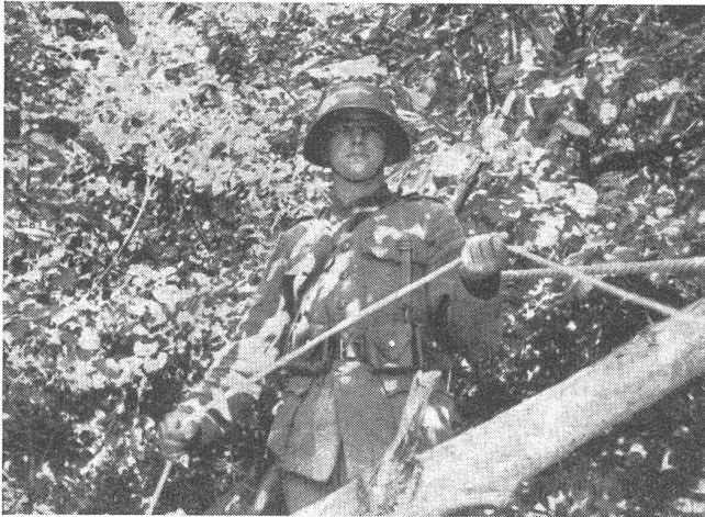
Sichern an der «Tyrolienne».

Ein wesentlicher Teil dieser Ausbildung muß der richtigen Geländebeurteilung gewidmet sein. Der Grenadier muß in einem Flußabschnitt den für den Bau einer Seilver-