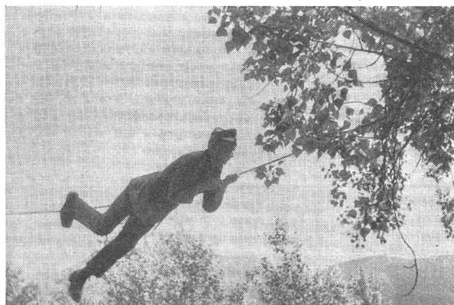
Ausbildung an der zwischen 2 Bäumen gespannten «Tyrolienne».

Die Ausbildung im Bau und Betrieb der «Tyrolienne» ist eine höhere Stufe der Seiltechnik, die besonders an die Führer höhere Anforderungen stellt und viel praktische Erfahrung voraussetzt. Die Benutzung der «Tyrolienne» ist einfach und rasch zu erlernen. Das Ausbildungsziel muß dahin gehen, daß jeder Grenadier in jedem Gelände auch eine solche Seilverbindung bauen kann.