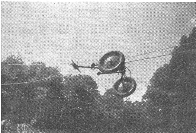
Transport einer Tb.-Lafette an der «Tyrolienne».

Ist keine Holzrolle im Korpsmaterial, kann an deren Stelle auch ein Karabinerhaken verwendet werden. Es ist aber zu bedenken, daß bei dauernder Verwendung das Seil darunter leidet.