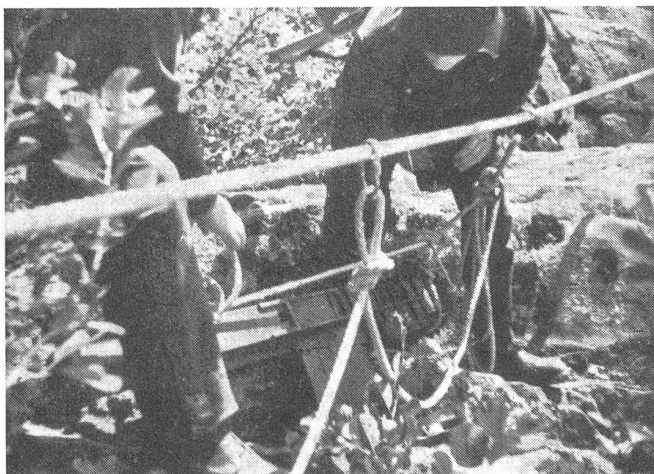
Munitions- und Korpsmaterial-Transporte.

Genau wie der geschilderte Personentransport, geht auch der Transport von Material und Waffen vor sich. Je nach