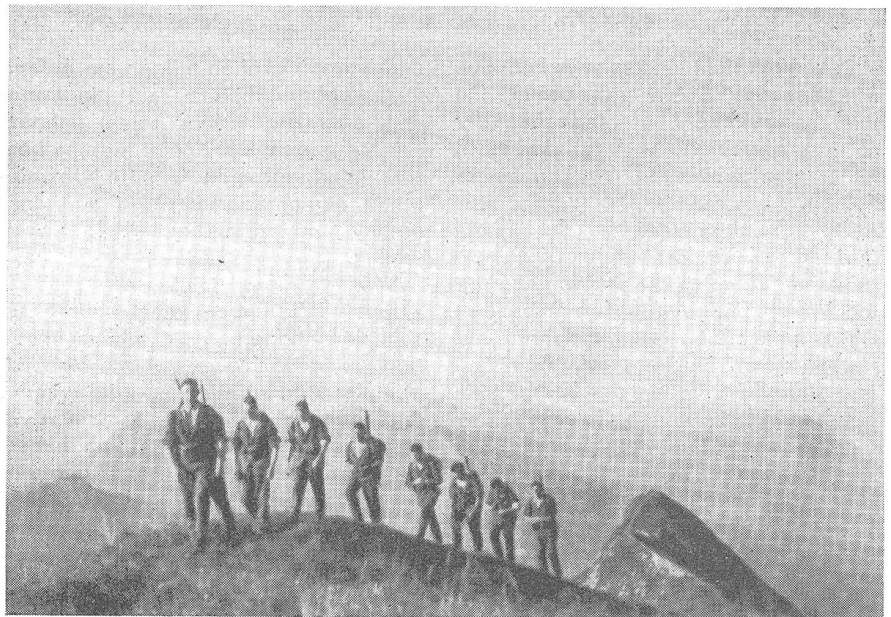
Auf den Spitzen und Kämmen der Heimat.

Langsam nur wich das Rot den ersten Schatten der einbrechenden Nacht, die mit dem schon freundlich blinkenden Abendstern ihren ersten Boten sandte. Mit der ersten Dämmerung wagten sich auch die Gemsen auf den Gipfel des Augstmatthorns, die gegen den