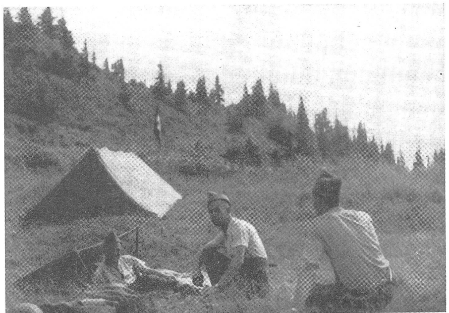
Im Zeltlager über dem Briener See.

So erinnere ich mich an die heißen Sommertage des Jahres 1942. Es war die Zeit der anhaltenden deutschen Erfolge, die Zeit einer fast aussichtslosen und scheinbar so unerforschlichen Entwicklung. Noch waren die Begriffe verwirrt und kein Zünglein gab an der Waage den Ausschlag für Gut oder Böse. Es war eine Periode, die es dem Einsichtigen schwer machte, den Wert und die Pflicht der langen Ablösungsdienste verständlich werden zu lassen und den gebrachten Opfern einen Sinn zu geben. Es war schwer, die geistige und körperliche Abwehrbereitschaft auf der nötigen Höhe zu erhalten. Durch die Ereignisse schienen uralte Werte