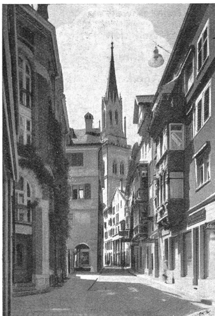
Kugellgasse mit St. Laurenzkirche