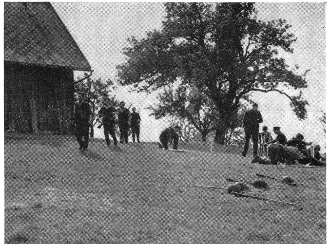
Eine Patrouille erreicht in guter geschlossener Ordnung mit der befohlenen Marscherleichterung den Posten Oberkapf. Eine Patrouille ist bereits mit dem Lösen der Aufgaben beschäftigt.

Eine ständige Kontrolle der Pisten ist unerlässlich. Hierzu eignen sich vor allem Motorradfahrer und Reiter, die wenn möglich in entgegengesetzter Richtung der Konkurrenten zirkulieren. Die Markierungen der Strecken müssen kontrolliert werden und eventuelle «Spione» und Wegweiser sind unschädlich zu machen. Der Zuschauer-