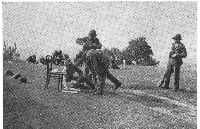
Eine Patrouille erhält ihre Aufgabe auf einem Posten.

Bedauerlicherweise waren als Kampfrichter Stabsoffiziere, die aktive Kommandos haben, spärlich vertreten. Sie scheinen sich für die außerdienstliche Arbeit ihrer Uof wenig zu kümmern.