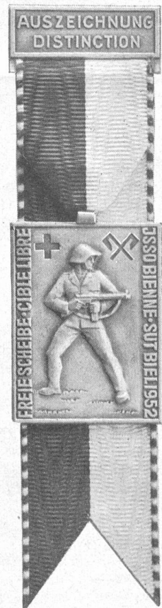
HUGUENIN LE LOCLE