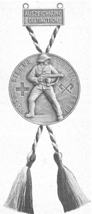
HUGUENIN LE LOCLE

21. Oktober 1951: Jahresversammlung der Veteranen-Vereinigung des SUOV in Neuenburg.