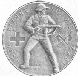
HUGUENIN LE LOCLE