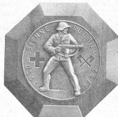
HUGUENIN LE LOCLE

Sektionsplakette in Silber und Bronze (in reduzierter Größe)